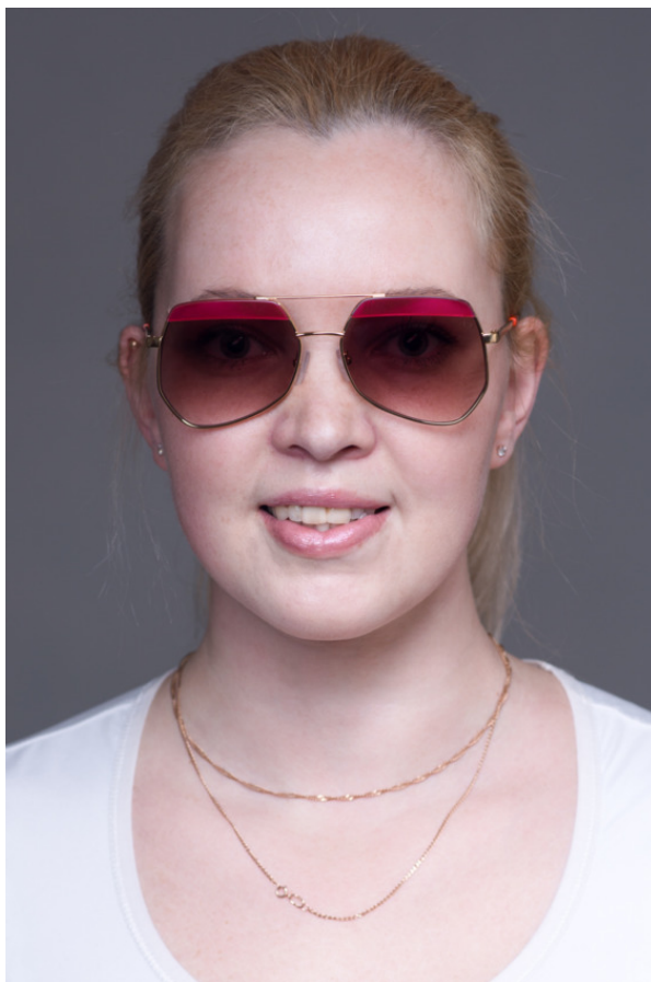
Овальная форма лица