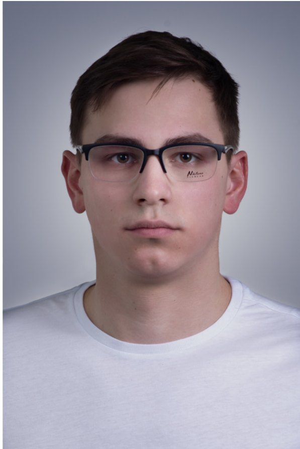
Овальная форма лица