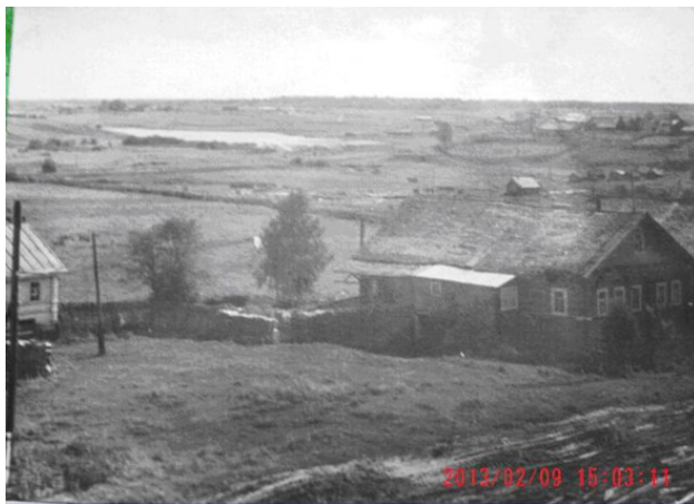
Вид из деревни Семёновской на Кумзерское озеро. 1965 год.

На ферме в Павших висит плакат, кто-то написал на нем: «В 1908 году в Кумзере жило 4950 человек. В 1985 году – 560». Летом 1997 года было 430 постоянных жителей. За почти 100 лет население уменьшилось в 10 раз. Понятно, что война особенно подкосила деревню, все же только из Кумзера с войны не вернулись около пятисот мужиков, целый батальон, а пришли домой всего человек триста. Но ведь в первые послевоенные годы народу было еще много, не меньше, чем до революции, и не столько война, сколько 50-60-е годы уменьшили население. Тогда уезжали даже те, кто и ехать-то не хотел. Прав был герой Федора Абрамова: «Война да горлопаны подкосили деревню».