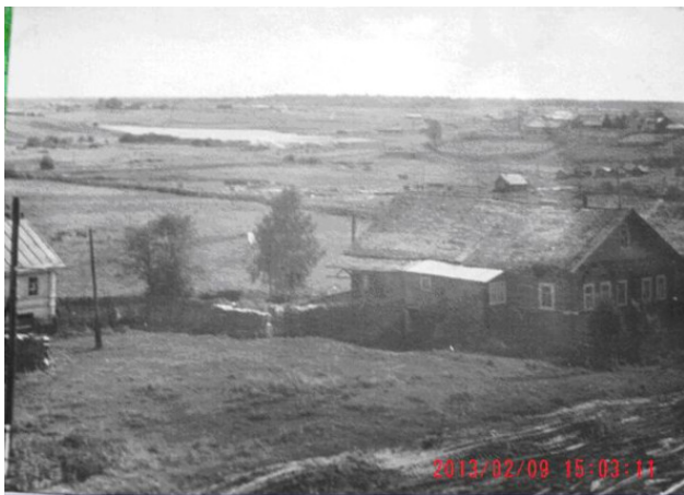
Вид из деревни Семёновской на Кумзерское озеро. 1965 год.