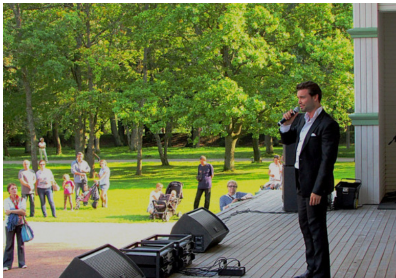
В парке «Дубки»

го нам исполнителя. Остановились поодаль от сцены и стали внимательно слушать его песню «Чёртово колесо» на стихи Евтушенко. Слушать этого певца было настоящим праздником! При своём великолепном голосе он, не жалея себя, щедро вкладывал в песню свою душу. Пел, как в последний раз. Удивил, восхитил, обрадовал! Этому голосу было место не здесь, на маленькой летней сцене, а в большом, многолюдном концертном зале. И почему прежде, за пределами Санкт-Петербурга и Ленинградской области, я не слышала этого замечательного певца, не видела его по телевидению?