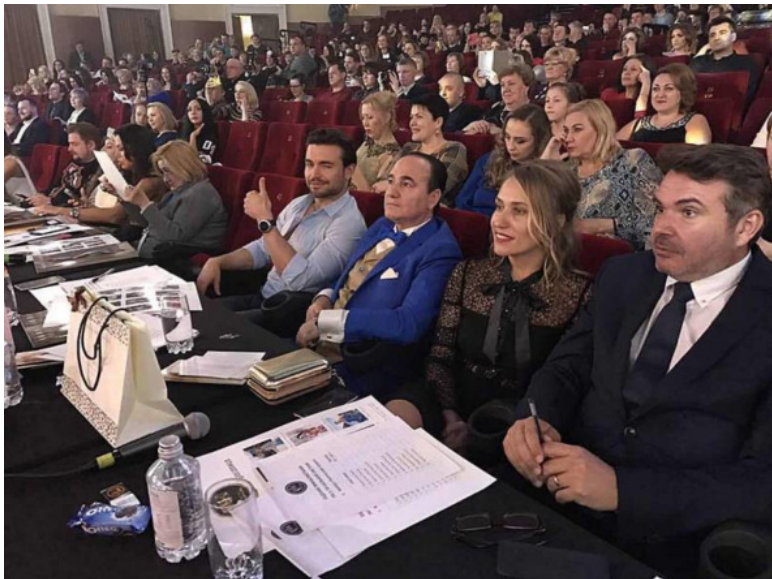
Работа в составе жюри Международного конкурса-фестиваля искусств «Global Fest Петербург»