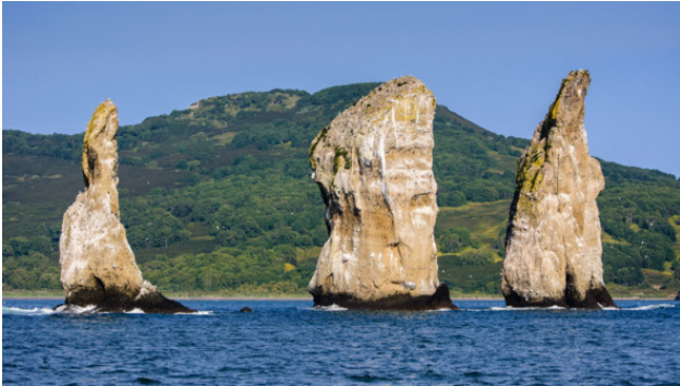
Три Брата (Авачинская бухта)

На самом краешке России, Где солнце раннее встаёт, И ветры дуют штормовые, Есть сердцу милый уголок.