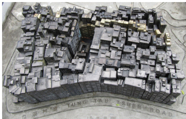
Коулун-Сити, прообраз Дома

Население – миллиард человек, в здании столь высоком, что на верхних этажах уже не хватает воздуха для дыхания. Зачем Дом создан? Защита от терроризма, в условиях того, что бомба, подобная по силе ядерной может быть создана на кухне, дошедшая до абсурда охрана окружающей среды, контроль над капризным человечеством. Но, наверное, о том лучше знают те сервисы, которым всегда так хочется знать ваше местоположение, номер телефона, много еще чего, которым удобнее иметь дело с людьми, постоянно обитающими в пронизанном вай-фаем пространстве.