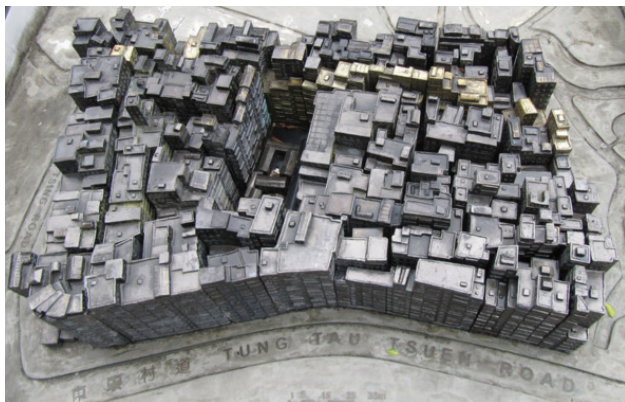
Коулун-Сити, прообраз Дома

Население – миллиард человек, в здании столь высоко, что на верхних этажах уже не хватает воздуха для дыхания. Зачем Дом создан? Защита от терроризма, в условиях того, что бомба, подобная по силе ядерной может быть создана на кухне, дошедшая до абсурда охрана окружающей среды, контроль над капризным человечеством. Но, наверное, о том лучше знают те сервисы, которым всегда так хочется знать ваше местоположение, номер телефона, много еще чего, которым удобнее иметь дело с людьми, постоянно обитающими в пронизанном вай-фаем пространстве.