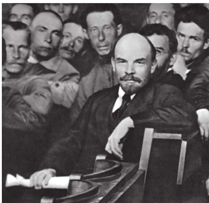
В. И. Ленин с делегатами X съезда РКП(б). 1921 год

«Вот видите, мы забрали солдат у эсеров, и теперь эсеры ни с чем, а солдаты наши».