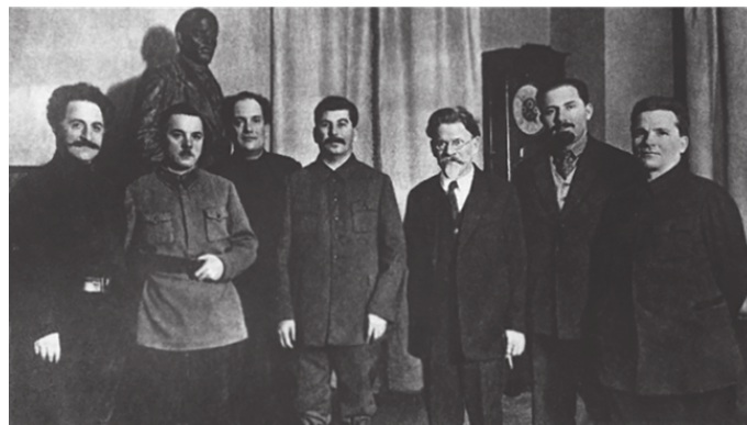
Г.К. Орджоникидзе, К.Е. Ворошилов, В.В. Куйбышев, И.В. Сталин, М.И. Калинин, Л.М. Каганович и С.М. Киров в день 50-летия Сталина