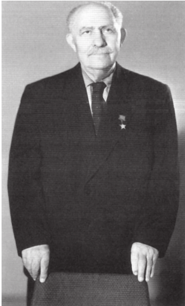
Лазарь Каганович в конце 80-х годов