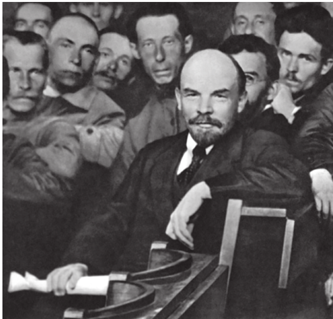
В. И. Ленин с делегатами X съезда РКП(б). 1921 год

Вот мое знакомство. После этого я бывал у него не раз. На Шестой съезд Советов я уже приехал из Воронежа – был председателем губкома в Воронеже. А раньше в Нижнем Новгороде работал. Молотов стал там председателем бюро исполкома. В комнате Большого театра Ленин подошел ко мне и Молотову, положил нам руки на плечи: «Поговорите между собой». И, обращаясь к Молотову: «Вы недавно приехали в Нижний, а он там работал, многое вам расскажет,