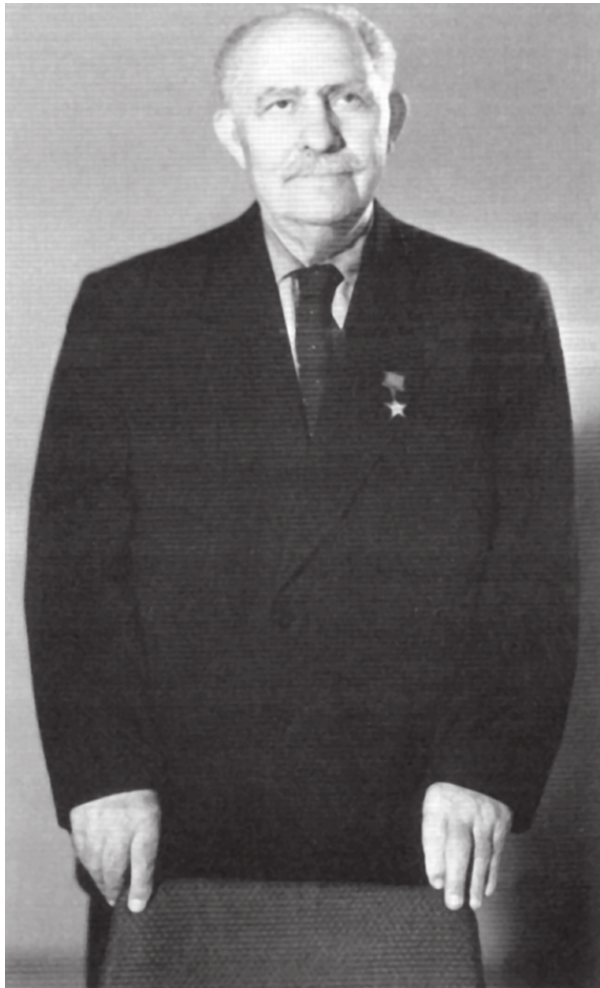
Лазарь Каганович в конце 80-х годов