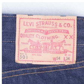
Рисунок 10. Фирменная этикетка Леви Страусс

лась. Предприимчивый Страусс сообразил, что парусина может быть использована по другому назначению, и начал шить из привезенной парусины штаны. Это и были первые джинсы! Неожиданно новая одежда стала пользоваться большим спросом. В 1873 году он с Джекобом Девисом получил патент на «Комбинезон без верха», и учредил компанию «Леви Страусс».