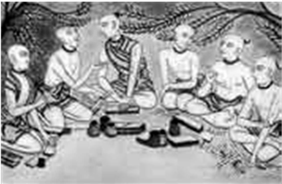
Шестеро Госвами Вриндавана

Так Шрила Баладев Видьябхушан в одиночку отправился в Джайпур, чтобы принять вызов. Его задачей было обосновать принадлежность гаудия -вайшнавов к подлинной вайшнавской традиции. Рамананди опирались на учение Рамануджи и вели происхождение от Шри-сампрадаи. Шрила Баладев Видьябхушан утверждал, что гаудия -вайшnavы принадлежат к Мадхва-сампрадае. Но Мадхвачарья ничего не говорил о поклонении Шри Шри Радха-Говинде и пути рага-марга – самозабвенной любви к Шри Кришне, – которому учил Шри Чайтанья Махапрабху. Рамананди потребовали обосновать учение Шримана Махапрабху комментарием ( бхашьей ). В то время любая сампрадая признавалась авторитетной только в том случае, если она имела бхашью на «Веданта-сутру», «Упанишады», «Вишну-сахасра-нама-стотру» и «Бхагават-гиту». Но в Рупануга-сампрадае не было комментария на «Веданта-сутру». Вместо него гаудия -вайшnavы почитали «Шримад-Бхагаватам», считая его комментарием, но пандиты школы Рамананди не соглашались с этим. Они требовали предъявить текст бхашьи , в противном случае спор решался в их пользу.