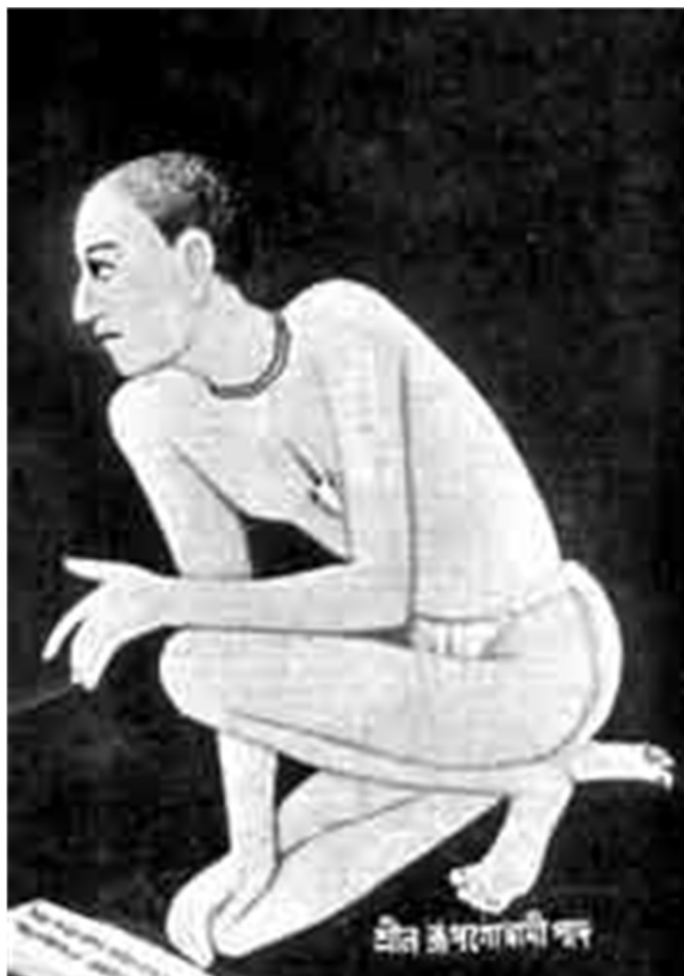
শ্রীল ঙ্গপনোবানী পদ