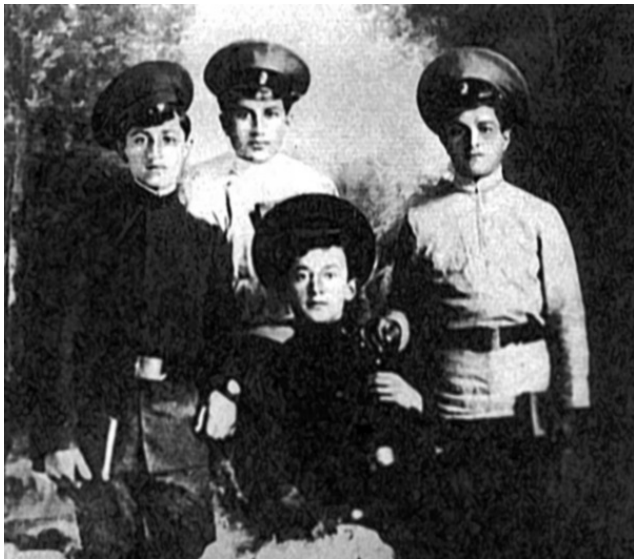
Лаврентий Берия (в центре) во время учебы в училище