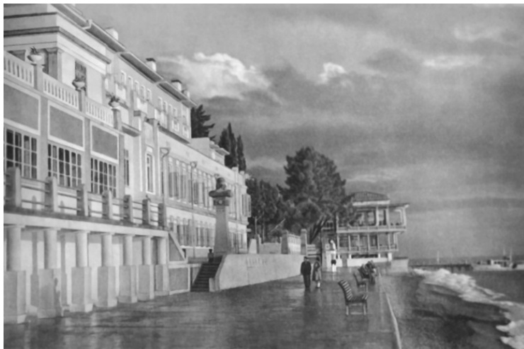
Санаторий «Кавказская Ривьера»

Когда Берия очищал от контрреволюции и иностранной агентуры Закавказье, он не только обеспечивал спокойствие Грузии, Азербайджана, Армении. Без бакинских нефтепромыслов, безопасность которых хранил чекист Берия, были бы невозможны успехи всей страны в первых пятилетках.