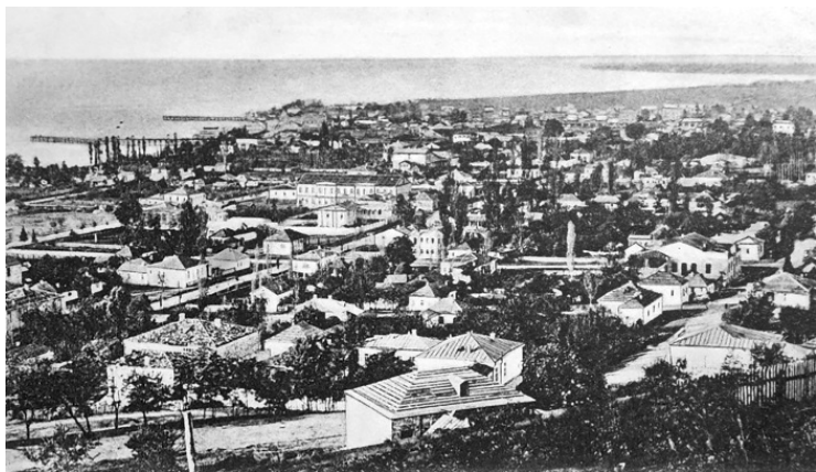
Сухуми. Начало XX века