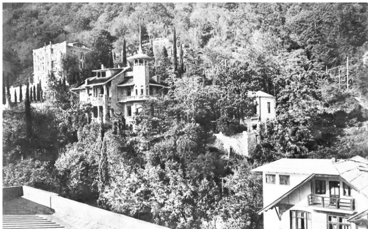
Санатории города-курорта Гагра. 1940 год

А марганец Чиатуры? Первый секретарь ЦК КП(б) Грузии Берия много сделал для развития его добычи, и нужен был этот марганец общесоюзной металлургии, общесоюзной экономике.