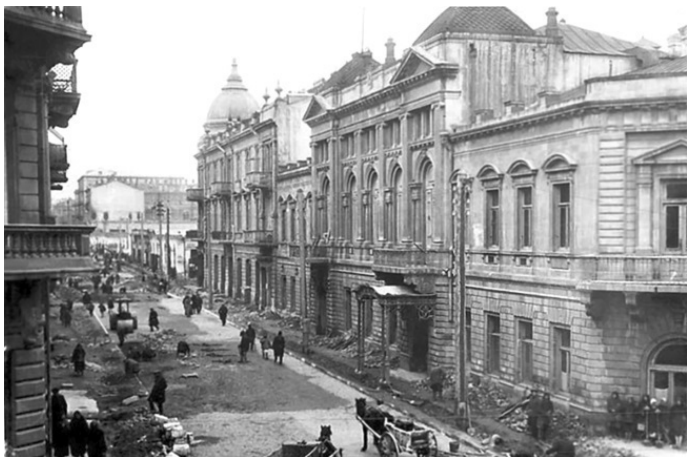
Улица дореволюционного Баку