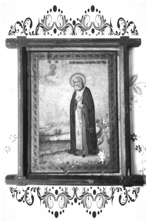
Икона Святого старца Серафима Саровского