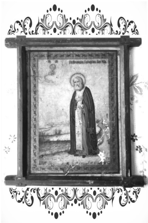
Икона Святого старца Серафима Саровского

Последние дни августа 1932 года выдались в Могилеве ненастными. Вот и в ту беспокойную для семьи Михаила Богдана ночь неистовствовала гроза, рассекая небо зигзагообразными молниями и разбрасывая по саду ветки мечущихся под разгулом стихии деревьев.