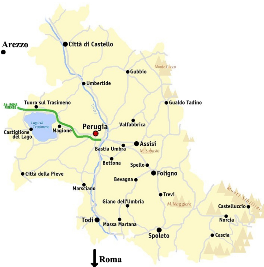
Карта провинции Перуджи (из Википедии).