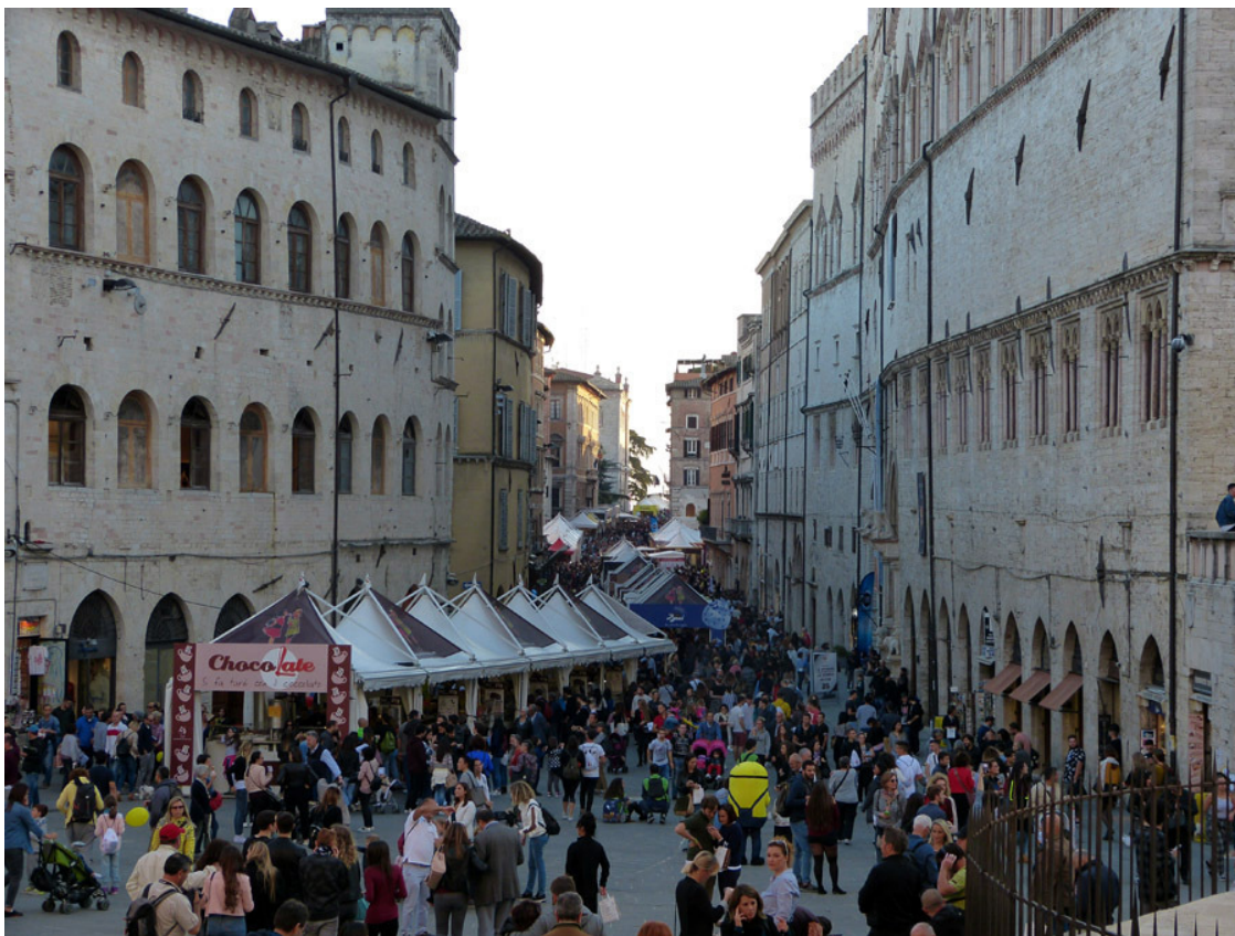
Eurochocolate, фестиваль шоколада на улицах Перуджи.

даже дежурили полицейские, чтобы народ побыстрее проходил и не создавал помехи движению.