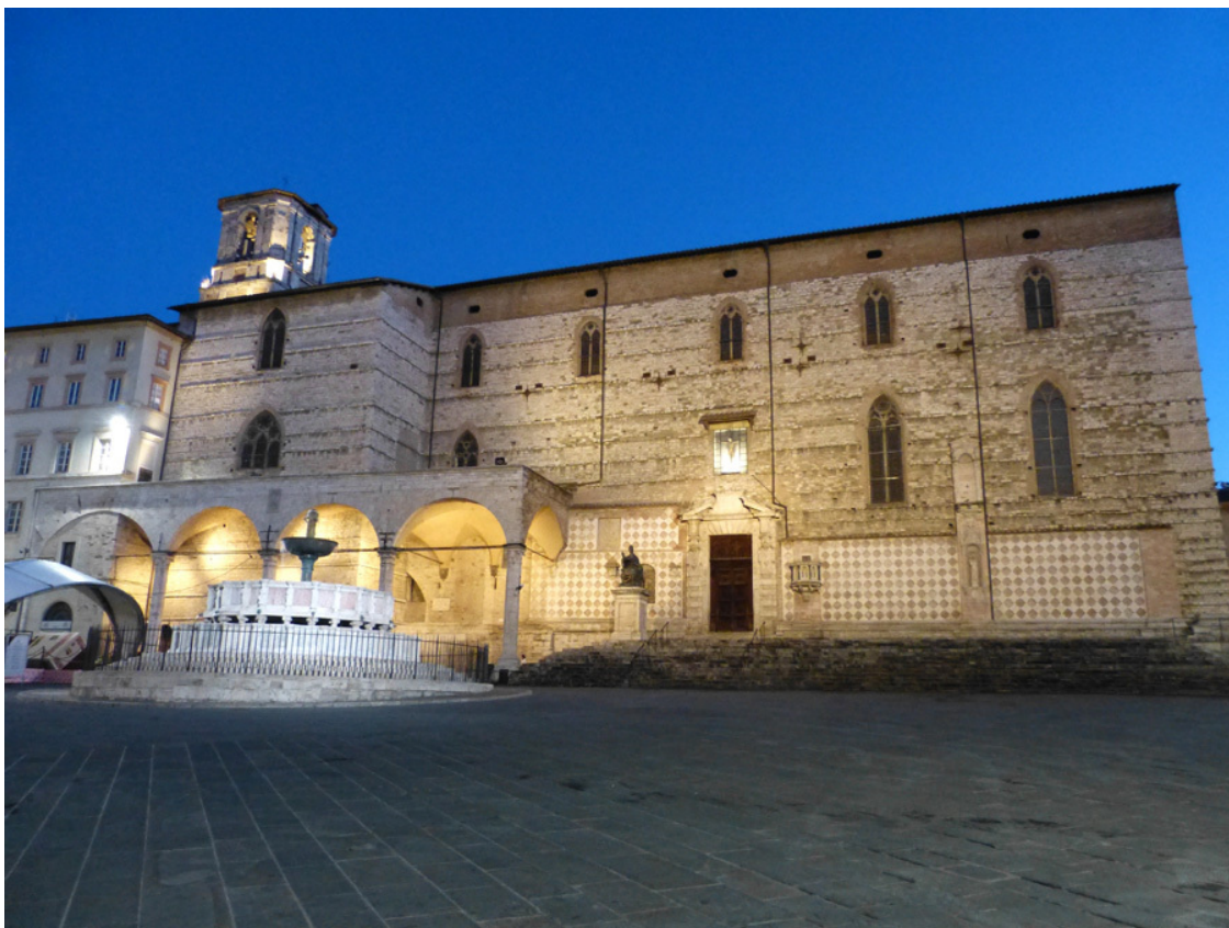
Собор и фонтан.