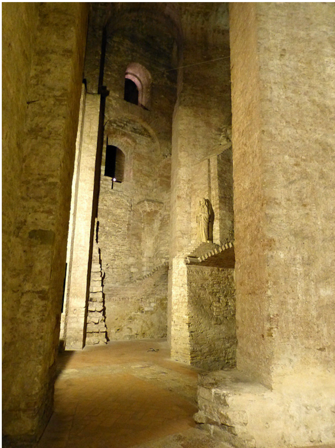
В подземных галереях Rocca Paolina.

Выйдя из подземелий, мы как будто попали с корабля на бал. Дело в том, что начиная с 1993 года, каждую осень в Перудже проводится Eurochocolate, фестиваль шоколада. И это мероприятие полностью поглощает основные площади и магистрали старого города: сады Кардуччи перед городской префектурой, площадь Италии, и две главных улицы. Они все оказываются заставленными павильонами участников фестиваля и заполнены толпами посетителей. Народу тут было, как в московском метро в час пик! Не протолкнёшься! На сходе с эскалатора