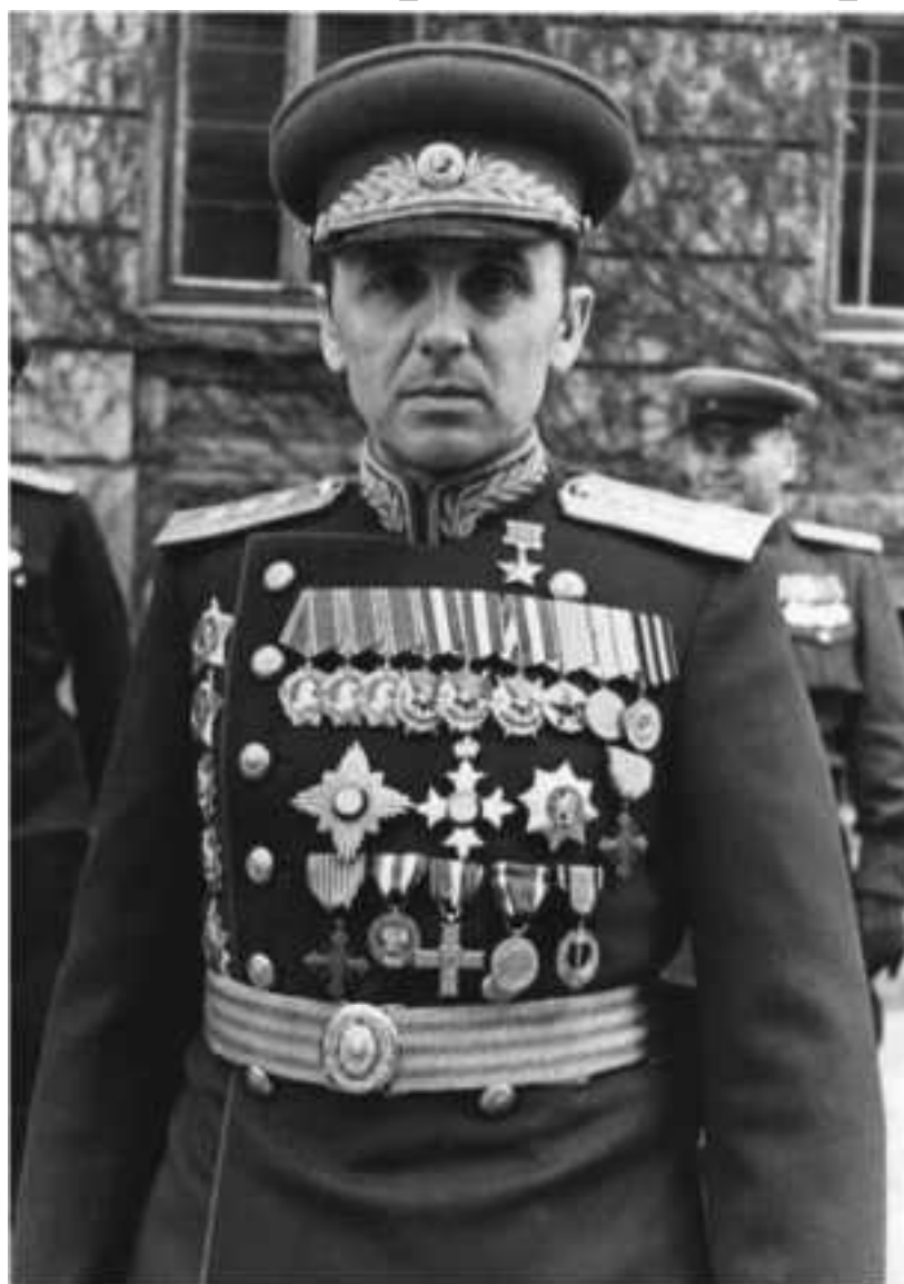
Генерал К.С. Москаленко

«Солдаты 38-й и 40-й армий присвоили Москаленко звание: "Генерал Вперёд!"»