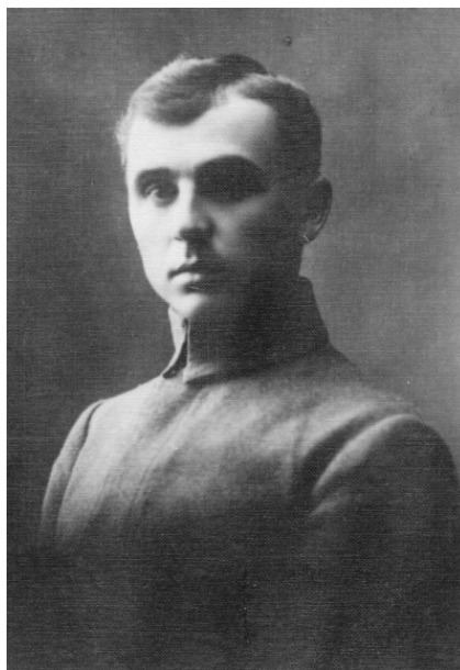
К.С. Москаленко в юности

Семье надо было как-то жить, и я принялся за работу. Уходил в поле до рассвета, возвращался затемно. Трудиться я привык с детства, но никогда ещё работа не была так тяжела, как в тот год, когда на Украине хозяйничали немецкие захватчики и контрреволюционные банды. Лошадей у крестьян осталось мало, и они их одалживали друг другу. Поля подверглись как бы нашествию сорняков, и прополка изнуряла.