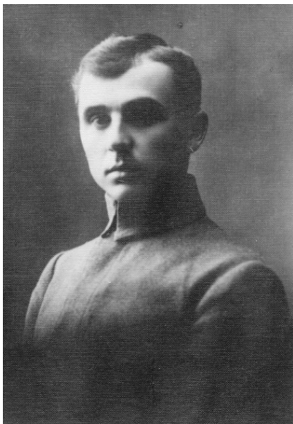
К.С. Москаленко в юности

Семье надо было как-то жить, и я принялся за работу. Уходил в поле до рассвета, возвращался затемно. Трудиться я привык с детства, но никогда ещё работа не была так тяжела, как в тот год, когда на Украине хозяйничали немецкие захватчики и контрреволюционные банды. Лошадей у крестьян осталось мало, и они их одалживали друг другу. Поля подверглись как бы нашествию сорняков, и прополка изнуряла.