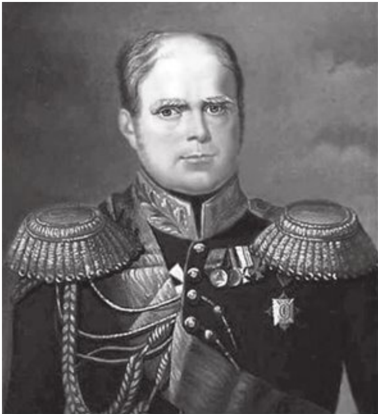
в. кн. Константин Павлович

В конце 1815 года Высшая военная полиция подверглась реорганизации, превратившись в Военно-секретную поли-