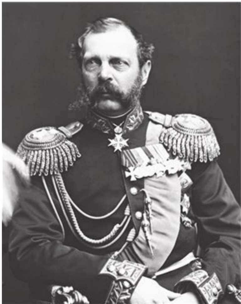
Император Александр II