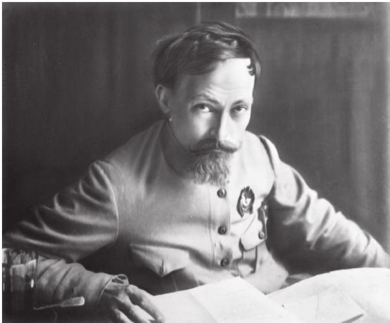
Ф. Э. Дзержинский (1877–1926) (Фото 1919, Москва)