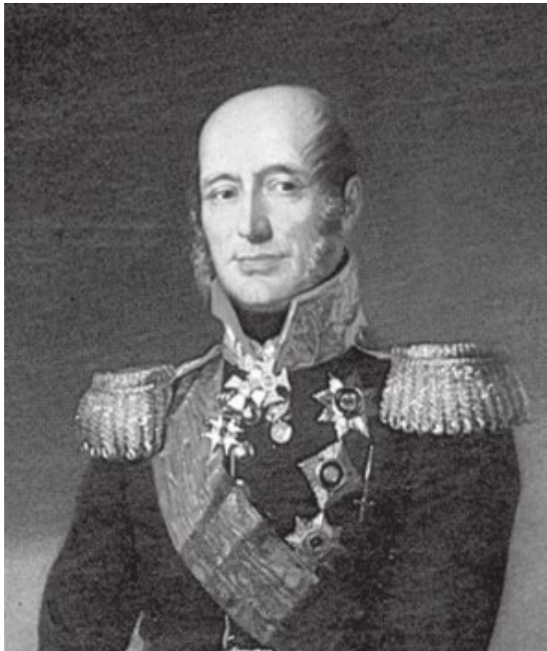
М. Б. Барклай-де-Толли