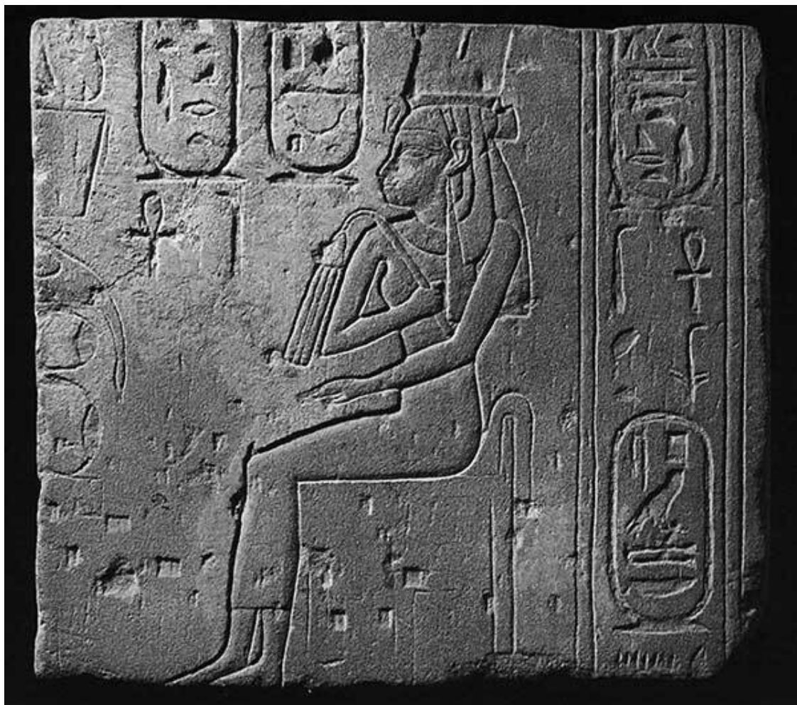
Рельеф «божественной супруги» Нитокрис. Примерно 650 год до н. э. Государственный музей древностей, Лейден

Жрецы управляли Египтом очень долго, но и каста воинов время от времени делалась значительнее, и жрецы вынуждены были делить с нею свою власть. Тогда, говорили жрецы, люди наследовали богам в управлении Египтом. Считается, что первым человеком, который царствовал в Египте, был Менес. Именно он в третьем тысячелетии до н. э. заложил город Мемфис.