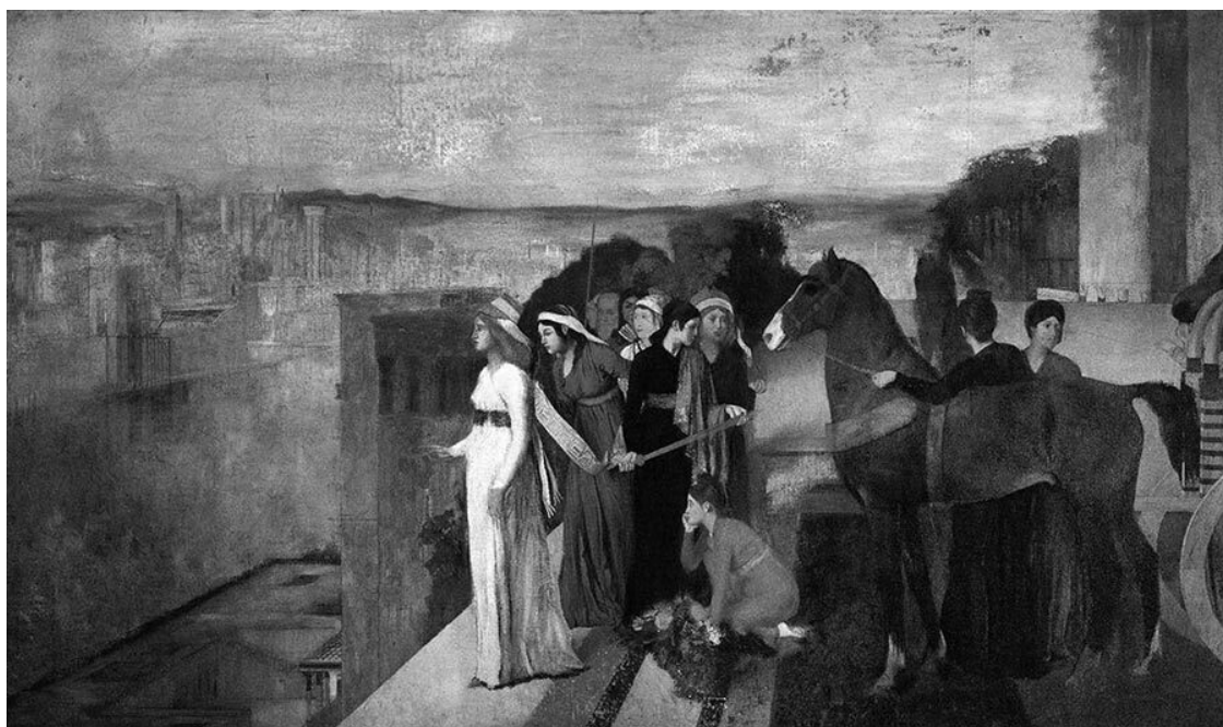
Семирамида строит Вавилон. Худ. Эдгар Дега (1861). Музей Орсе, Париж

Взойдя на трон, она украсила Вавилон, сделав его одной из мировых диковин: она построила несколько дворцов и создала для них удивительную систему водоснабжения (говорят, для этих работ она использовала труд двух миллионов рабочих), построила гигантский подъемный мост, а также множество дорог.