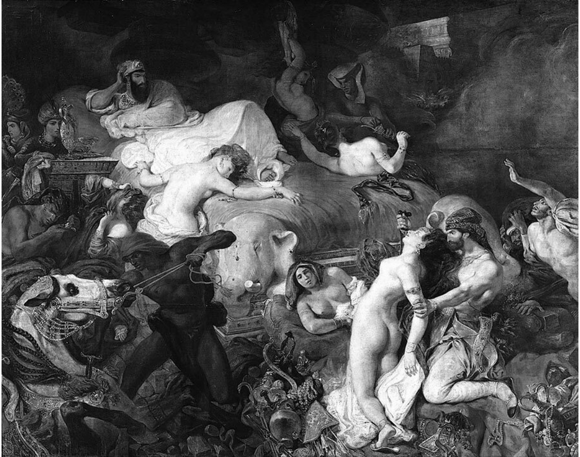
Смерть Сарданапала. Худ. Эжен Делакруа (1827). Лувр, Париж

На картине изображен момент, когда царь приказывает убить своего любимого коня, собак и женщин, уничтожить все свои сокровища.