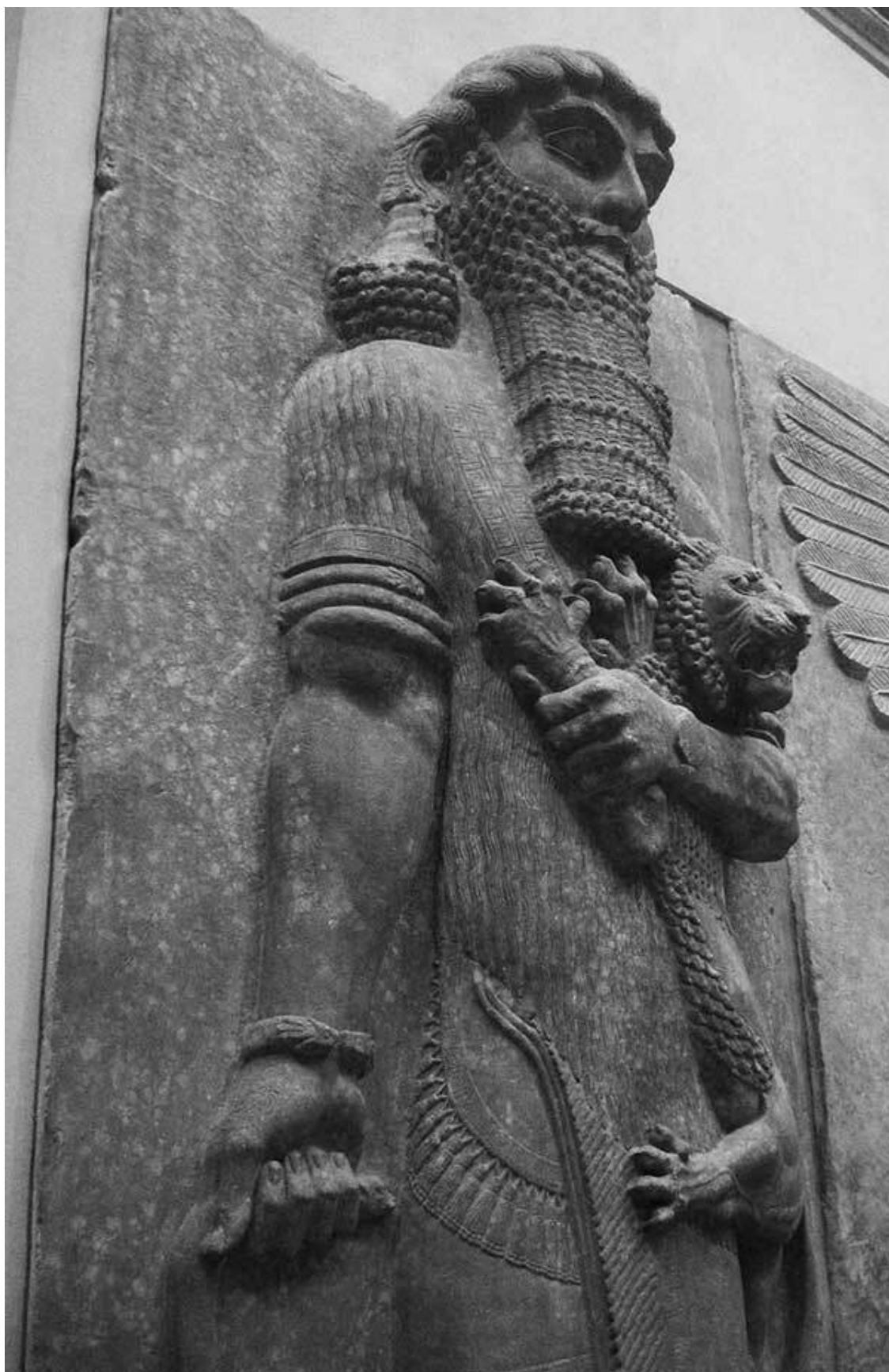
Гильгамеш со львом. VIII век до н. э. Лувр, Париж