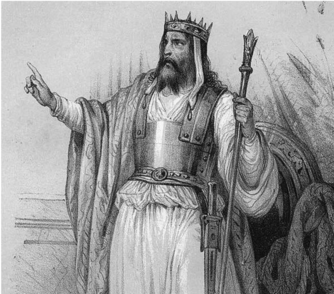
Царь Навуходоносор II

При втором нововавилонском царе Навуходоносоре II (604–561 гг. до н. э.) в Вавилоне появились новые богатые постройки и мощные оборонительные сооружения, велись успешные войны с Египтом, а Финикия, большая часть Сирии и Палестины, включая Иудею, были захвачены.