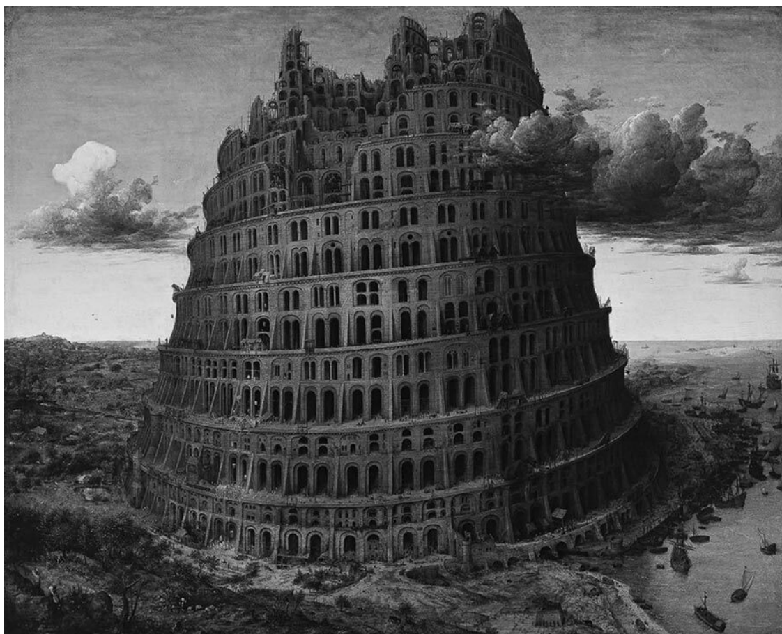
Вавилонская башня. Худ. Питер Брейгель Старший (1565)

Это краткое содержание того, что рассказывает Моисей о начале мира.