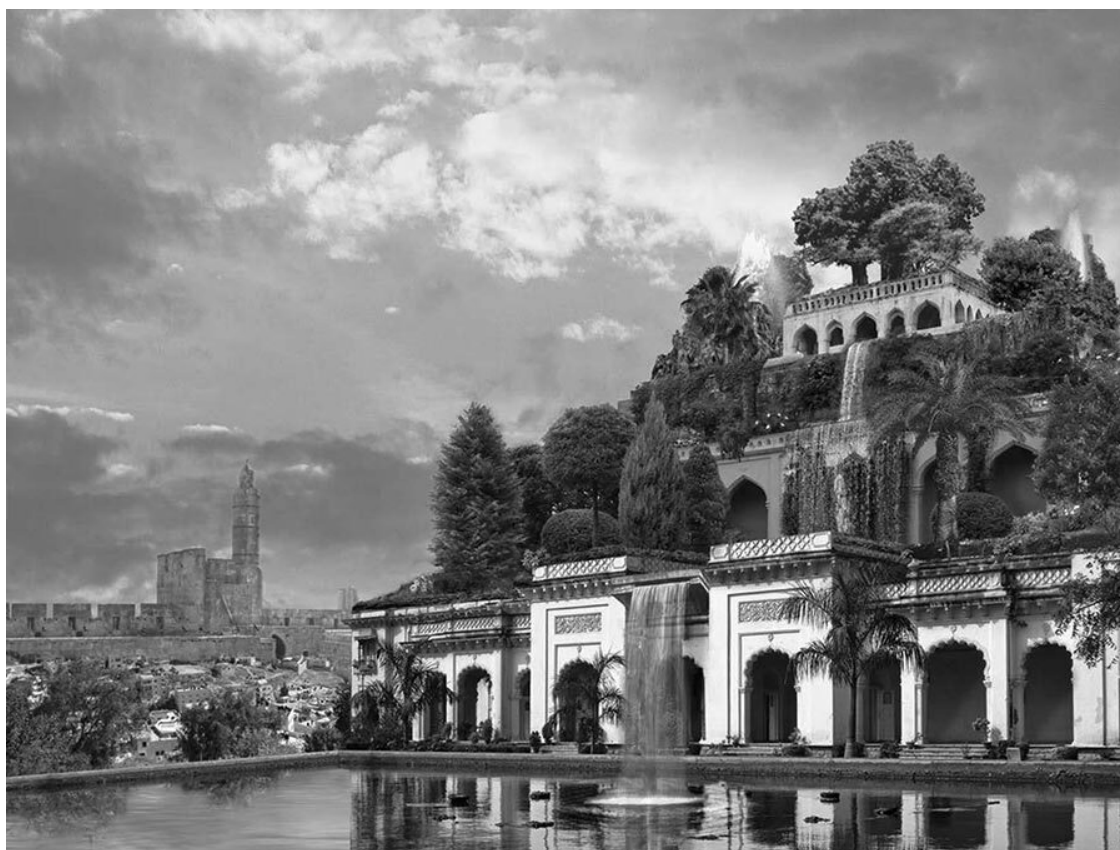
Висячие сады Семирамиды (реконструкция)

Эти сады были устроены из четырех ярусов – наподобие пирамиды. Ярусы (этажи) поддерживались монументальными колоннами и были полностью засажены всевозможной растительностью. Но что самое удивительное – необходимые условия для роста деревьев и цветов, привезенных со всего мира, поддерживала сложная система орошения. Так что поразителен был не только этот цветущий парк посреди пустыни, но и тщательно продуманный механизм его жизнеобеспечения.