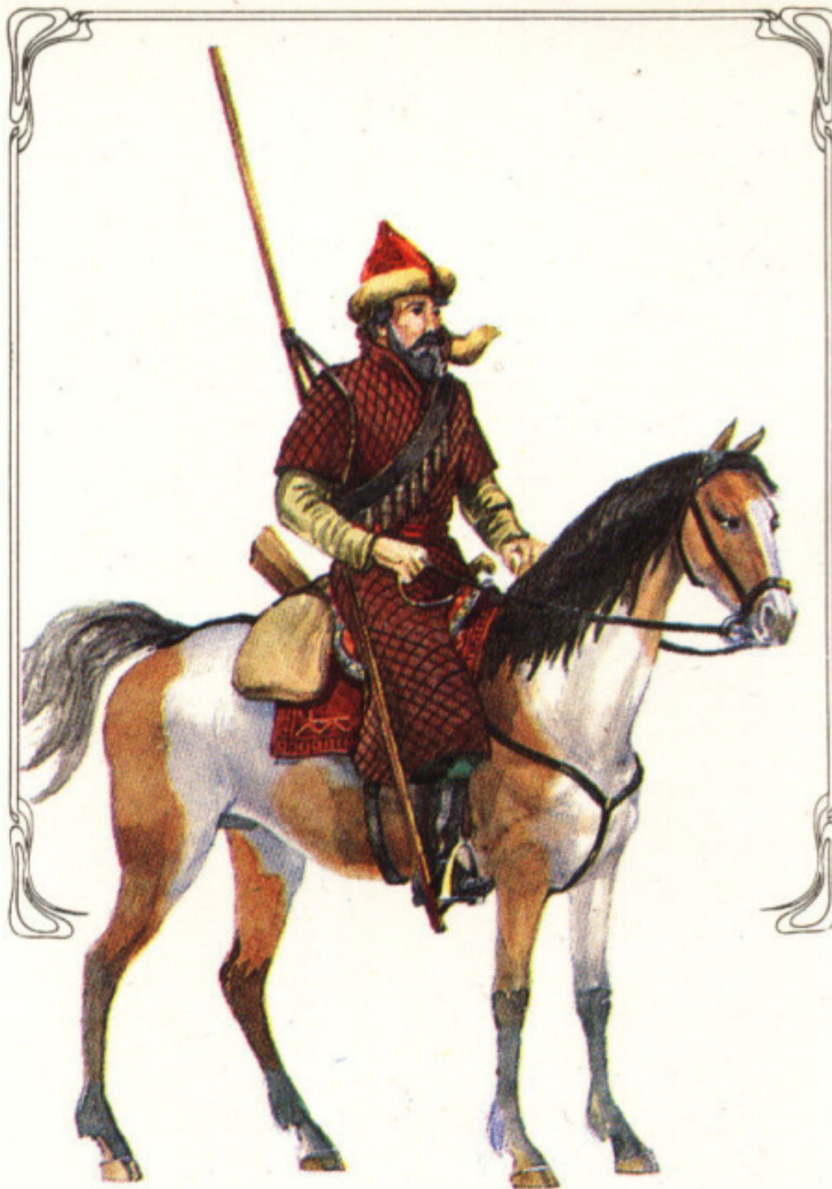
Западно-сибирский казак в XVII в.