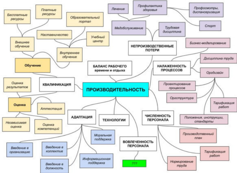
Рисунок 2. Производительность персонала.