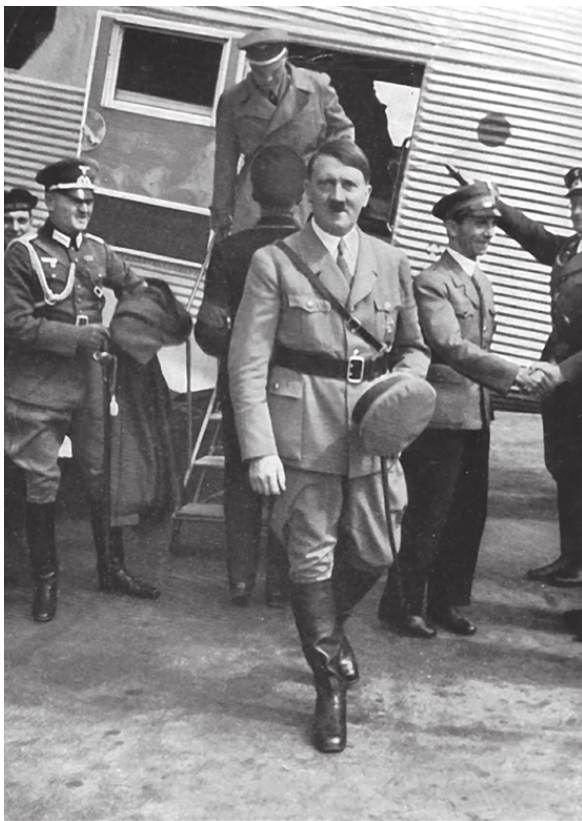
Адольф Гитлер выходит из самолета. 1935 год

Для людей осведомленных не было секретом, что фюрер намерен воспитать новую германскую армию в духе своих идей, он охотно прислушивался к мнению офицеров – сторонников стремительного маневра и высокого уровня подго-