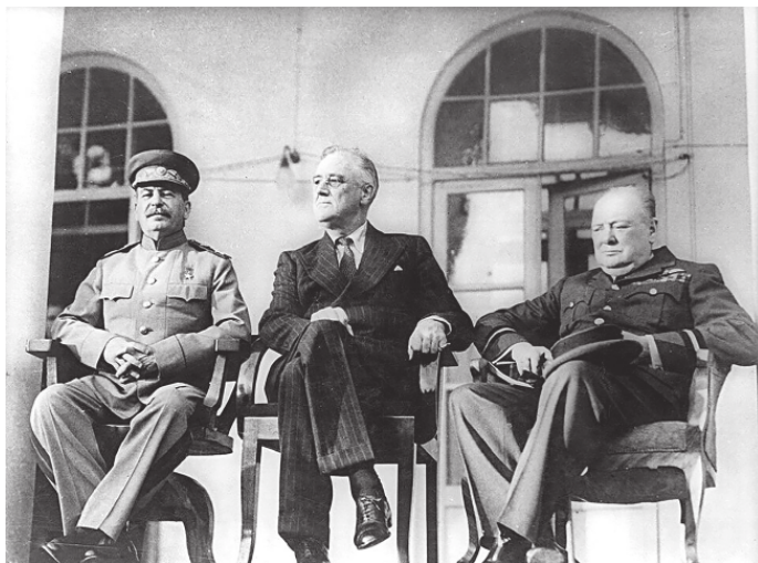
И. В. Сталин, Ф. Д. Рузвельт У. Черчилль в Тегеране

дениями Северной Африки, а другой – вдоль ее берегов, оба они и не подумали установить с нами связь.