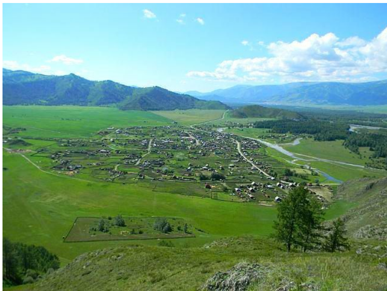
Село Верхний Уймон с горы Верхушка. 2011 год.

жизнь усвоил: Верх-Уймон, Усть-Кокса, Кокса, Мульта, Катунь, Белуха и другие названия сел, рек, речек и гор – даже и не зная, что это такое и где находится.