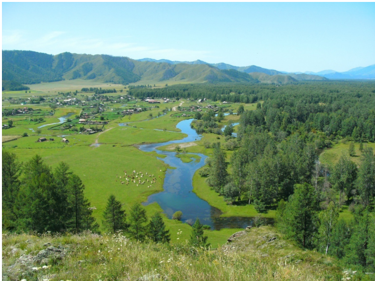
Горный Алтай, деревня Тихонькая. 2010 год.

А вокруг – зеленые горы, а вдали – горы в снежных шапках: белки... Впервые на одну из ближайших гор я забрался тогда, в 1964-м, вместе с одним из многочисленных родственников, троюродным братом. Вот, я стою на фотографии, сделанной им: за мной, внизу – районный центр Усть-Кокса, а в долине сливаются реки, зеленая – Кокса, и голубая (белая!) – Катунь. И синее небо... Цвета я запомнил с тех