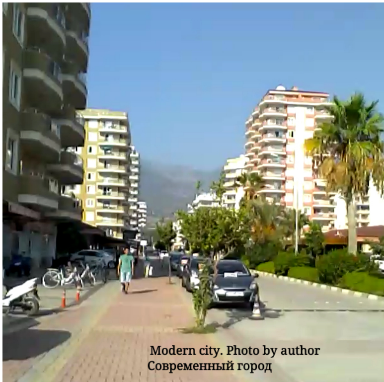
Modern city. Современный город