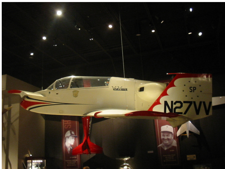
«ВериВигген» в музее

можно было заметить явные следы непростой жизни, которую ей довелось прожить.