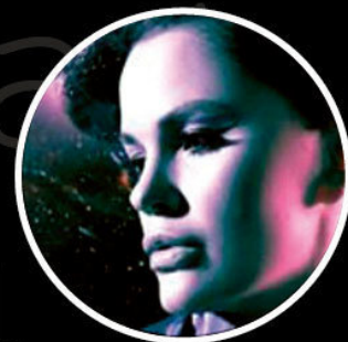
aliyaprokofyeva 134 тыс.