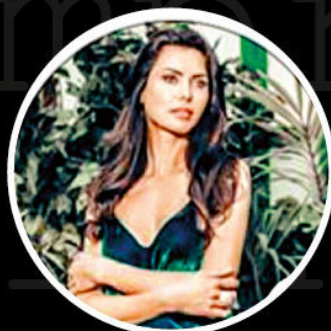
nataliya_resh 73,3 тыс.