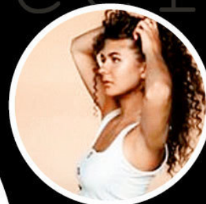
ra_radika 63,2 тыс.