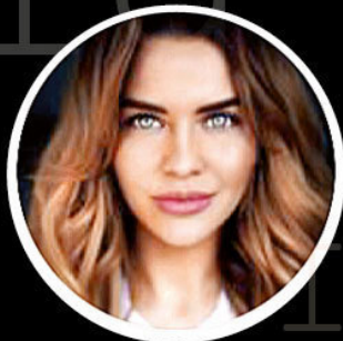
marina.dvornikova 171 тыс.