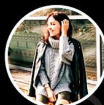
yanochka_khu 75,5 тыс.