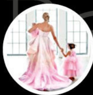
julia_neshutka 103 тыс.