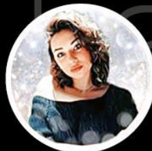
ig_lisalin 217 тыс.