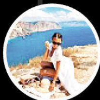
irina_shakhlo 133 тыс.