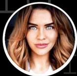
marina.dvornikova 171 тыс.