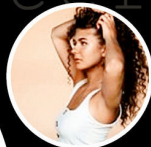
ra_radika 63,2 тыс.