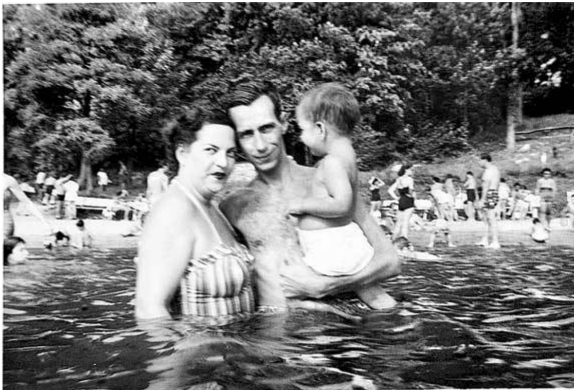
Мы с мамой и папой на озере Мохеган-Лейк в Нью-Йорке

Если мы игнорируем это – так, похоже, полагали мои родители, – то этого не существует. Эта философия определяла и порядок в нашем доме, и большую часть моего детства. Для сложнейших ситуаций я получал простейшие ответы. Но вопреки тому, что родители проблему мою игнорировали, все остальные ее замечали.