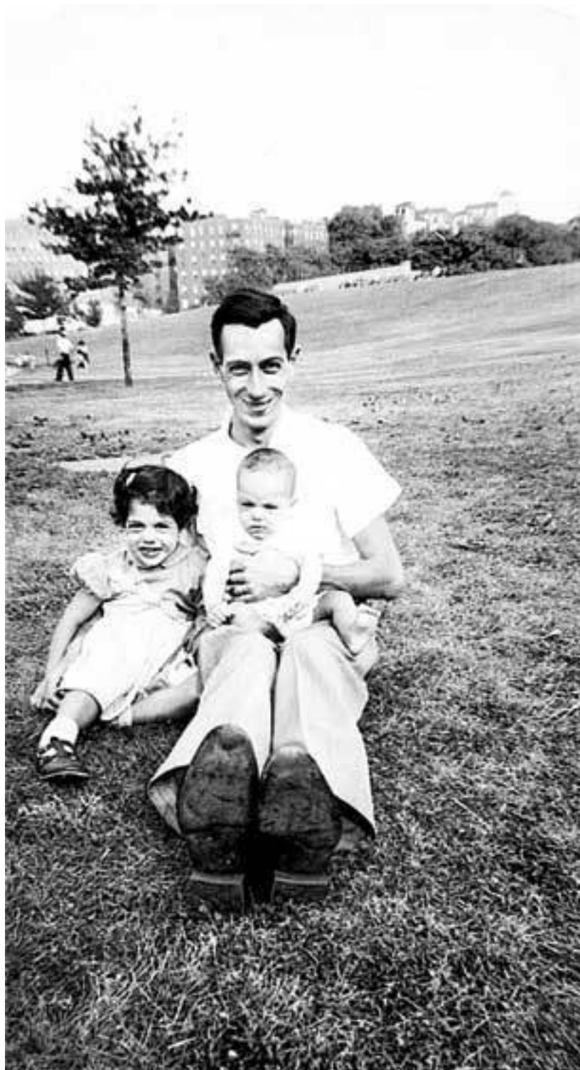
Моя сестра, папа и я в парке Инвуд-Хилл недалеко от нашего дома в Верхнем Манхэттене, 1952 год