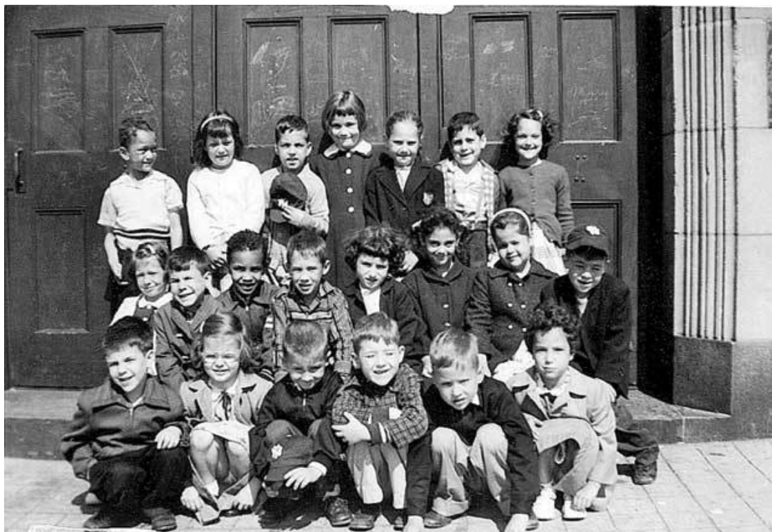
Верхний ряд, третий слева: в первом классе, в позе бейсболиста. P.S. 98, 1958 год