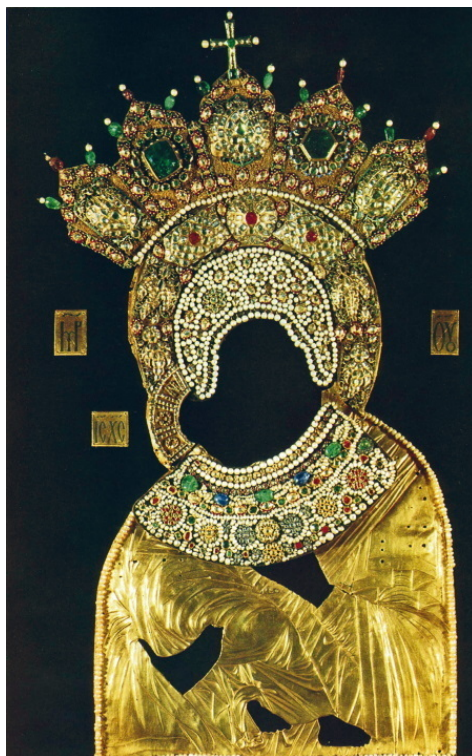
Современный вид уцелевшего оклада Владимирской Богоматери. Музеи Московского Кремля

Официальная опись найденного гласит: «золотой венец, весом в пять фунтов с пятью коронами из крупного жемчуга и драгоценных камней, золотой запон с 39 крупными алмазами, два больших граненых изумруда с расположенными вокруг них 32 изумрудами меньшего размера, 52 крупных алмаза, в верхних коронах: 10 крупных изумрудов, 4 рубина и 14 бурмицких зерен, в средней короне: алмазный крест из 9 крупных алмазов, крупный рубин с бурмицкими зернами...» Уф, пальчики устали перепечатывать, это только четверть списка, полную опись читайте в «Московских церковных ведомостях» (выходные данные см. в «Библиографии», я ведь свою третью книгу решила прилично оформить, по ГОСТу, прям как у взрослых). Общим счетом, короче, 602 бриллианта ценой больше полумиллиона рублей.