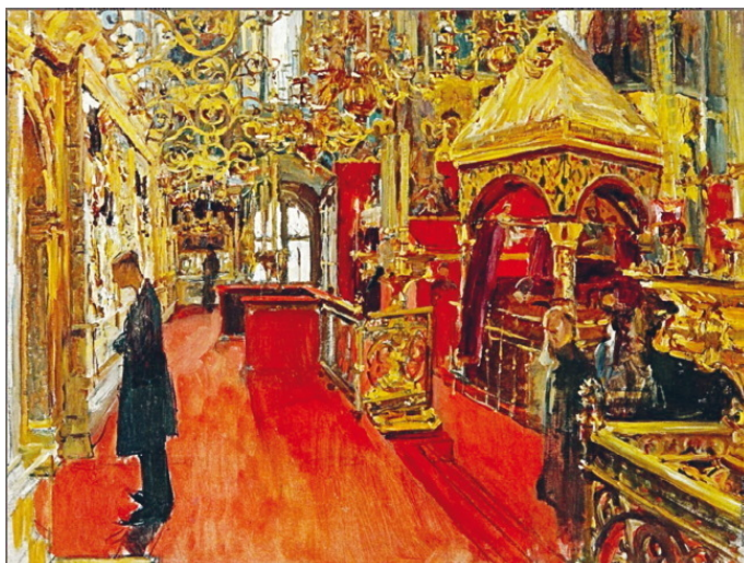
Дореволюционный интерьер Успенского собора на картине Валентина Серова. 1896. Национальный художественный музей Республики Беларусь

Вот изумруды вору-то и приглянулись. Судя по уликам, он залез внутрь «шкафа», притворил за собой дверцы (чтобы поменьше шуметь) и ювелирным инструментом их отковырял, а потом другие камни, что на окладе были.