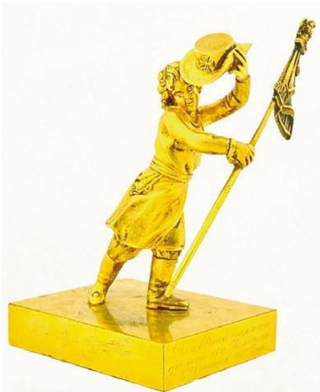
Похищенное бронзовое пресс-папье с фигуркой ополченца