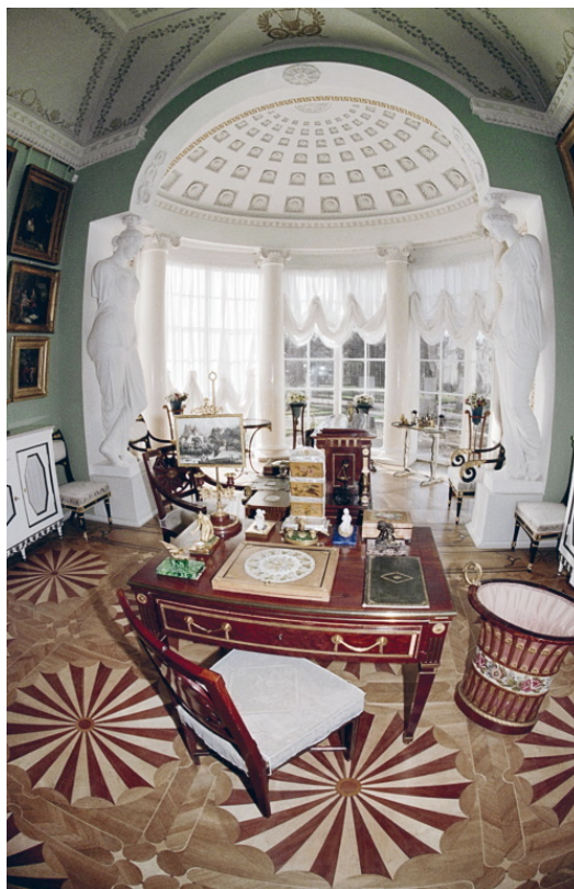
Кабинет «Фонарик» в Павловском дворце