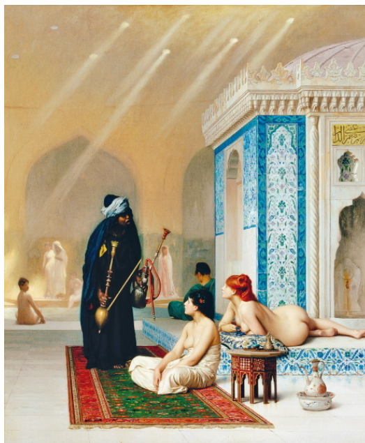
Жан-Леон Жером. «Бассейн в гареме». 1875. Эрмитаж