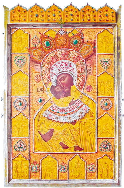
Владимирская Богоматерь в полном драгоценном окладе. Рисунок Федора Солнцева из издания «Древности Российского государства», 1846—1853