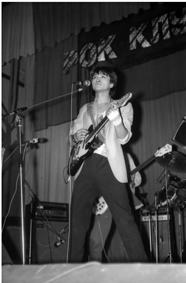
Цой. 3й фестиваль рок-клуба.

и тот же Додолев, я думал... ничего я не думал: жадно слушал и смотрел.