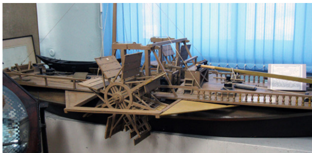
Баржа Кулибина, идущая против течения

В замкнутой системе подобное движение было бы невозможно. Но зачем замыкаться?!