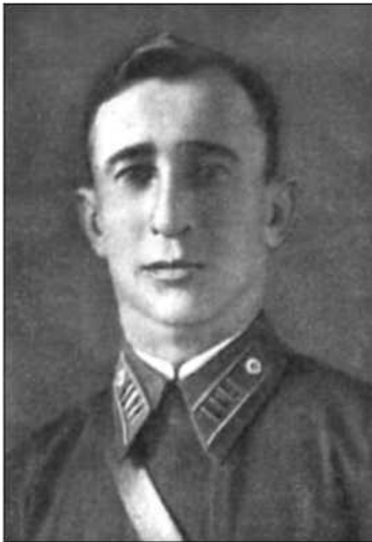
Командир 262-й стрелковой дивизии полковник Матвей Семенович Терещенко.

Уже днём 1 декабря вышел приказ штаба КФ № 011/ОП, в соответствии с которым войскам предписывалось произвести масштабную перегруппировку. Так, 22 армия должна была выделить в резерв комфронта моторизованную бригаду, имевшую в составе 4425 человек (из них 1264 стрелка, 98 пулеметчиков и 186 минометчиков), 268 лошадей, 135 автомашин, 3554 винтовки, 8 станковых и 39 ручных пулеметов, 5 122-мм и 20 76,2-мм орудий, 5 45-мм ПТО и 22 миномета 16 .