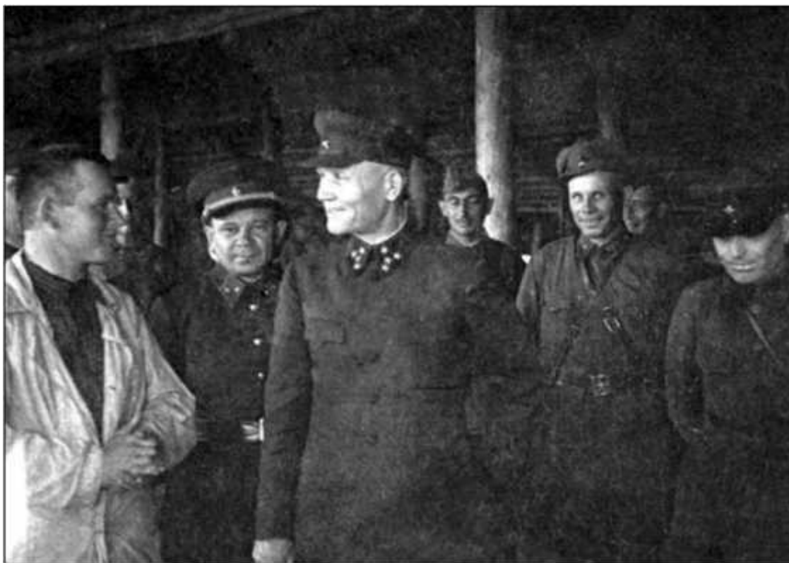
Командующий Калининским фронтом генерал-полковник Иван Степанович Конев (в центре) в штабе 31 – й армии, октябрь 1941 года.

С одной стороны, 9-я полевая армия вермахта, лишенная подвижных соединений 3-й танковой группы, осуществлявших наступление на Москву, не имела сколь-нибудь существенных возможностей для ведения активных наступательных действий (например, в направлении Торжка или Бежецка). Впрочем, подобных задач верховное главнокомандование сухопутных войск (ОКХ) перед ней уже не ставило.