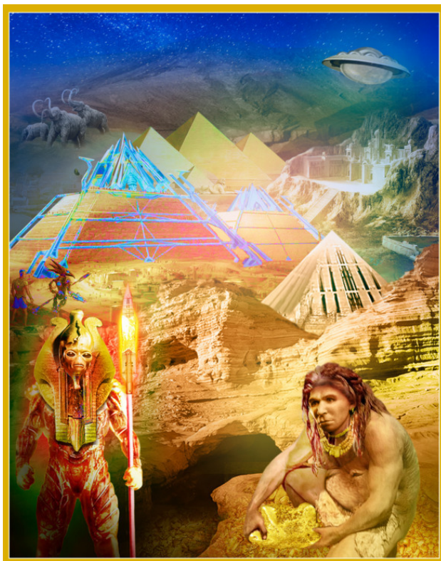
Добыча золота под управлением инопланетян.

Первые фараоны достигли своего могущества только через несколько тысячелетий, после того, как люди покинули Сахару и двинулись к Нилу. Там уже стояли пирамиды, оставленные пришельцами из далёкой планеты, которые потом прашуры египтян используют как погребальные памятники, а каменные строения превратят в храмы, испещрив иероглифами и рельефами покинувших их богов. И найдут здесь они солнечный металл – золото.