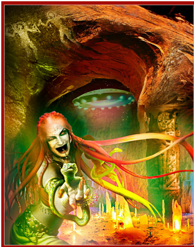
Демоническое божество Хотнгиза.

– Хостомар, – произнесла она, шагнув навстречу сквозь костёр.