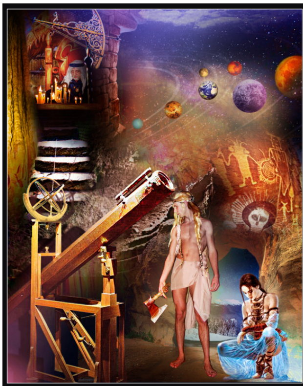
Хостомар и Ла-Тия у кнега Стилапанти.

Но самое любопытное место в пещере – потолок, он покрыт изображениями животных: быков, оленей, лошадей , бизонов, слонов... Роспись дополняют фрагменты на рельефных каменных стенах. В рисунках видна рука мастера, который наносил очертания животных едиными линиями, без поправок. Мастер использовал естественные краски: уголь, охру, алебастр. Но из такого небольшого выбора цветов получились удивительно многообразные оттенки. А дальше ещё удивительнее – огромные летающие ковчег, вырезанные изумительно тонко на скальной породе. И тайные знаки-иероглифы, совсем не похожие на те, что знал мастер Хостомар.