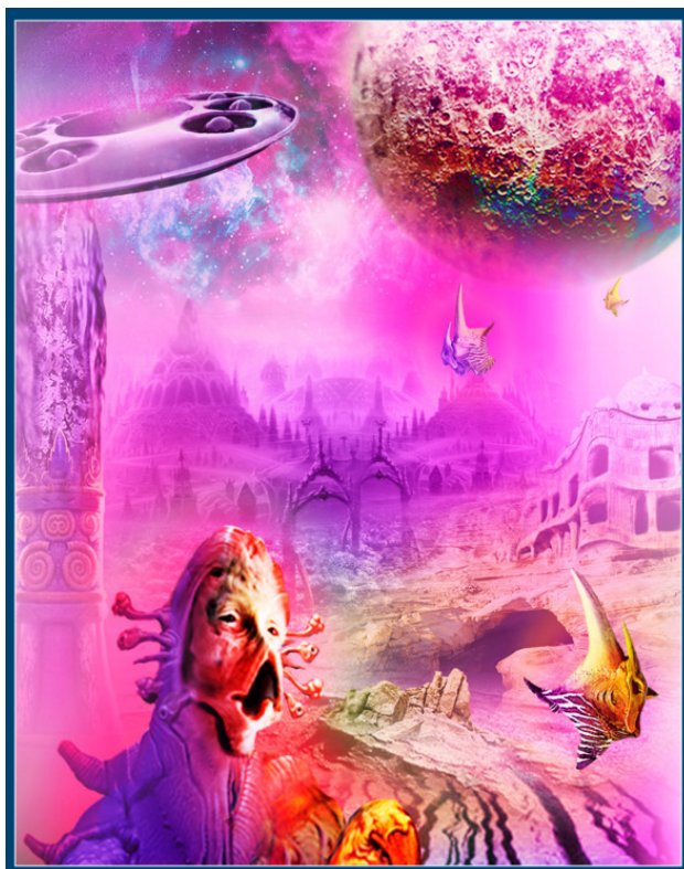
Йо – Сиреневая планета.

Пустыни и безжизненные холодные ландшафты Йо. В безветренном пространстве под слоями космической пыли покоятся руины древнейшей цивилизации солнечной системы. Исчезли газообразные океаны, превратившись в озера, растекающиеся лилово-сиреневым студнем по остывающей поверхности... Незыблемы лишь космические базы йотов, поддерживаемые пирамидальными генераторами-энергореакторами, питающие погибающую планету энергией Земли. Мощные порции энергии на время оживляли ее, превращая в виртуальный Эдем. Тогда животно-растительный мир планеты расцветал, распускаясь фантомами кармино-бардовых холодных и ярких окрасок, и причудливо-фантастических форм. Поэтому Йо – Сиреневая планета.