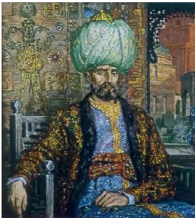
Имам Кул Шариф