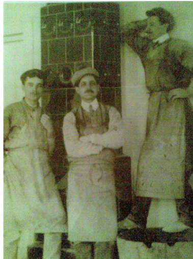
Фото из источника в списке литературы [10]

«Первое упоминание о существовании еврейской общины в Орше относится к 16 в. В административно-финансовом отношении она была подчинена Брестскому кагалу. В хартии короля Речи Посполитой (см. Польша) Яна II Казимира еврейская община Орши была упомянута в числе крупнейших в стране» [17].