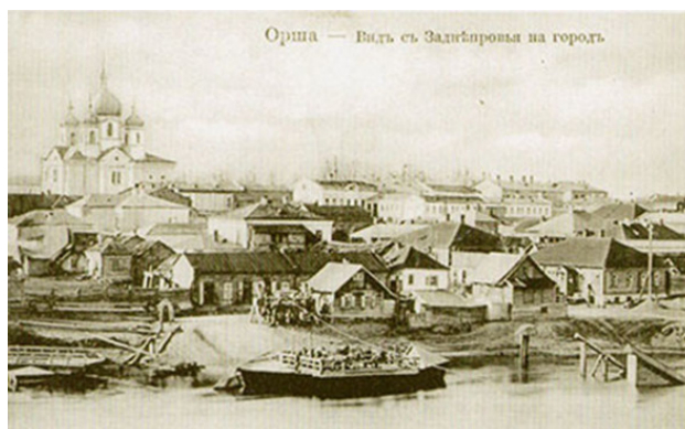
Фото из источника в списке литературы []