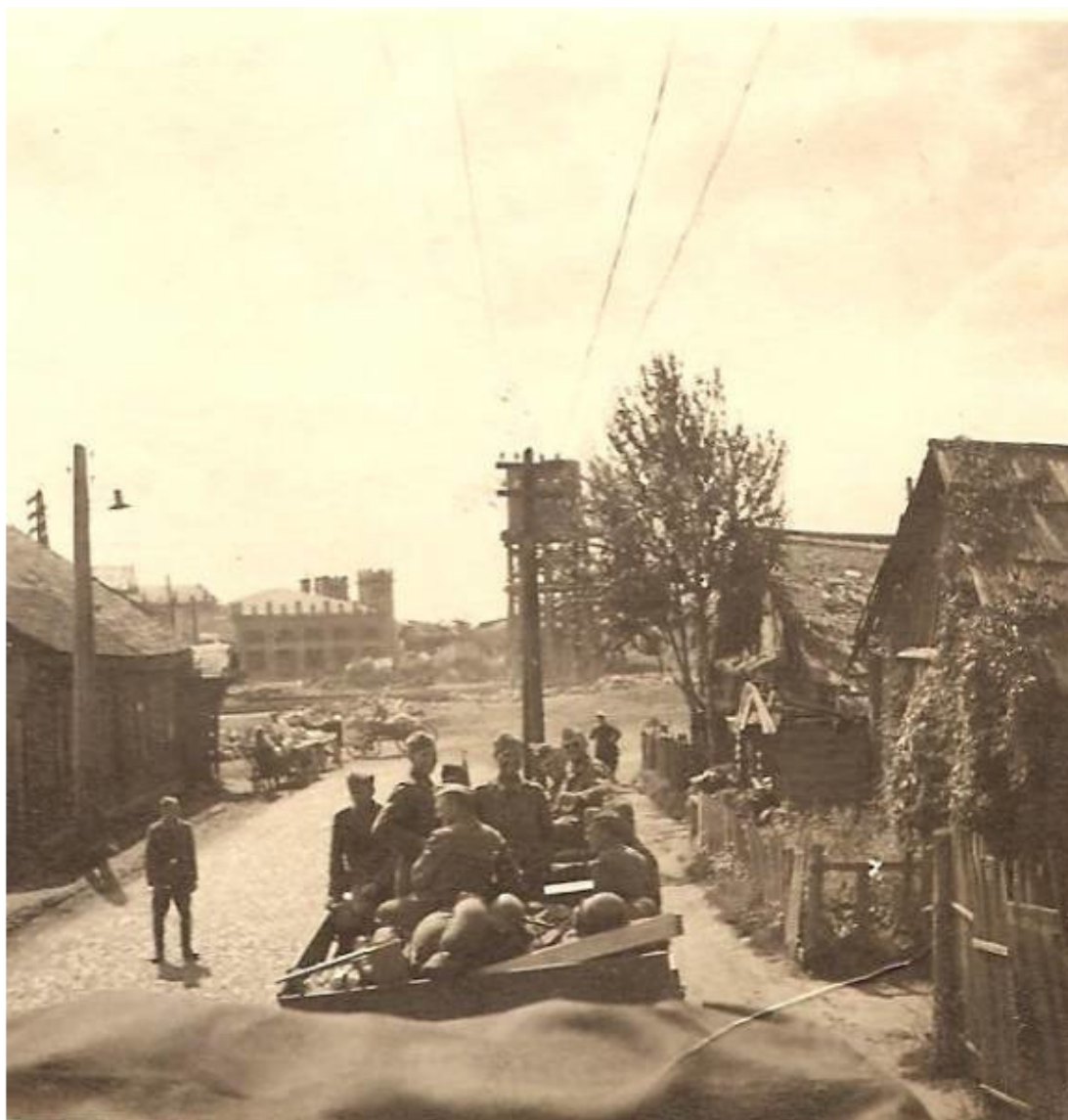
Дата: 1943.

Город на фотографиях времен 2-ой мировой войны. Орша