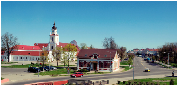
Фото из источника в списке литературы [1]

Орша (беларус. Орша) с 2013-го года является городом районной значимости находящимся в Беларуси, центром Оршанского района (Витебская область). Он располагается на реке Днепр – на месте, где в него впадает река под названием Оршица. От него севернее в восьмидесяти километрах находится Витебск. А на расстоянии двухсот двух километров (западнее) – столица Республики Беларусь Минск.