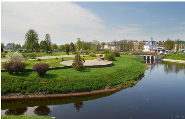
Фото из источника в списке литературы [9]