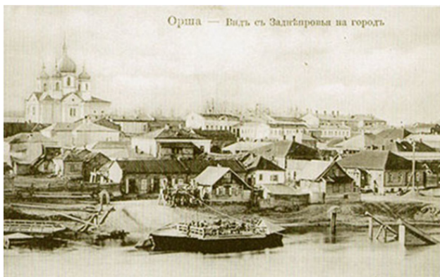
Фото из источника в списке литературы []