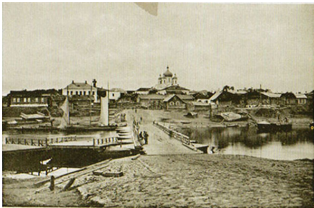
Орша.—Orcha. № 5. Видъ на городъ.

Фото из источника в списке литературы [4]