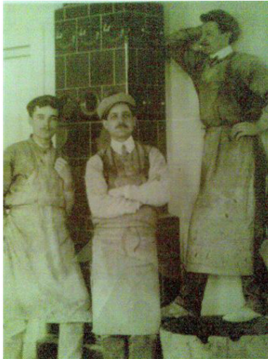
Фото из источника в списке литературы [10]

«Первое упоминание о существовании еврейской общины в Орше относится к 16 в. В административно-финансовом отношении она была подчинена Брестскому кагалу. В хартии короля Речи Посполитой (см. Польша) Яна II Казимира еврейская община Орши была упомянута в числе крупнейших в стране» [17].