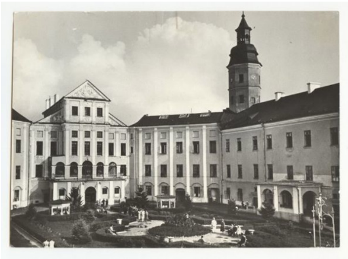
Замок Радзивиллов на старой фотографии.

1492-й год. Он явился годом передачи города великим князем Александром Петру по фамилии Кишка (один из литовских наиболее богатых магнатов). В итоге Несвиж стал принадлежать отличающемуся известностью роду Кишек. Одну из представительниц данного рода звали Анной. Ее в 1513-м году выдали за Яна Радзивилла, прозванного Бородатым, получившего в свое владение город в качестве приданого от своей будущей супруги.