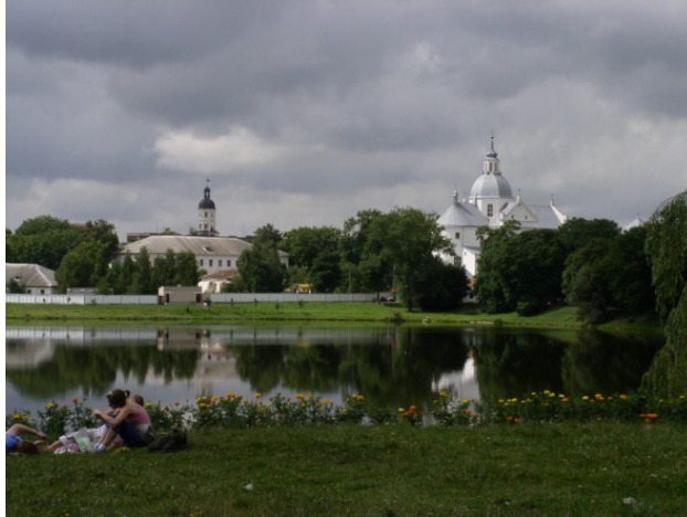
Фото из источника в списке литературы [15]