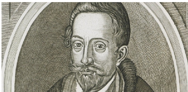
Николай Христофор Радзивилл Сиротка. Фото из источника в списке литературы [6]

Сиротка занимался и жизнью жителей города. Путешествия по Средиземноморским и Ближневосточным местам вдохновили Сиротку на инициацию перемен и переустройство его родного города. У него возникли идеи, которые требовали воплощения.