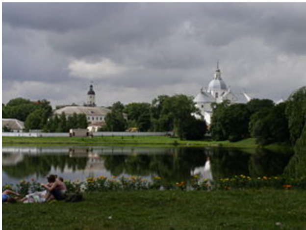
Фото из источника в списке литературы [3]

История Несвижа, описанная в «Wikipedia, the free encyclopedia», следующая [3]: