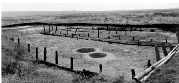
Следы от рядом расположенных печи и колодца в одном из жилищ