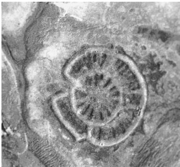
Аэрофотосъёмка 1956 г.

Что же было такого «эдакого» в Аркаиме, что разбудило воображение нашего доктора технических наук, да и не только его? Ведь Аркаим, несмотря на бытовые неудобства, всё же посещает множество людей. Зачем-то они едут?