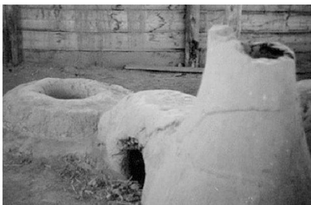
Реконструкция металлургического комплекса печь-колодец

Нашлось оригинальное объяснение всех этих фактов, согласно которому, колодец и печь представляли единый металлургический комплекс без мехов для поддува воздуха.