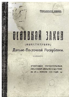
Фото 5. Обложка Конституции ДВР издания 1921 г.

«Положением о выборах в Народное Собрание ДВР», устанавливалось, что каждый кандидат мог баллотироваться не в пяти избирательных участках, как это имело место при выборах в Учредительное собрание, а в двух. Персональные списки кандидатов в депутаты вначале обсуждались в партийных организациях РКП (б), а затем на собраниях избирателей, проводимых под руководством коммунистов.