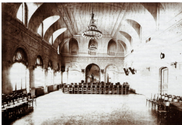
Фото 4. Зал заседания Хабаровской Городской Думы

Хабаровская городская Дума и Управа были упразднены в 1922 г. Что касается других городов Дальнего Востока и, то здесь зачастую выборные органы формировались по аналогичному сценарию, но где-то, как уже говорилось выше, раньше или позже Хабаровска 22 .