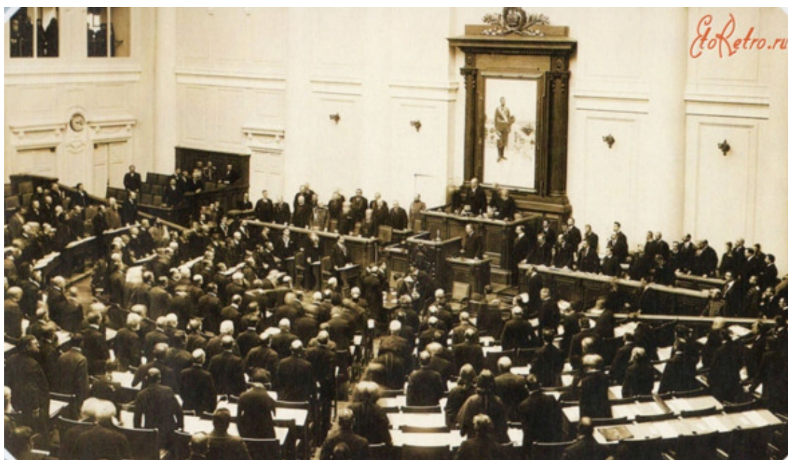
Фото 1. Заседание Государственной Думы

И, тем не менее, открытие в Петербурге 27.04.1906 г. I Государственной Думы было событием огромной исторической важности не только в нашей стране, но и во всем цивилизованном мире. Оно состоялось в самом крупном в столице Тронном зале Зимнего дворца и было обставлено весьма торжественно. Прибыло огромное число приглашённых, журналистов и дипломатических представителей из многих стран. Ждали царя, и он приехал. Однако «тронная» речь Николая II, в общем-то, тусклая и бесцветная, лишённая глубокого содержания, разочаровала присутствовавших. В довольно смятенном настроении депутаты Думы в тот же день отправились в построенный когда-то Потёмкиным при Екатерине II Таврический дворец для деловых заседаний.