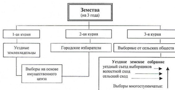
Схема 1. Структура и состав электората земского общественного управления

Однако в конце XX столетия у якутских историков появилась иная точка зрения на опыт якутского «самоуправления». Так, А. А. Борисов считает, что «выполняя на первых порах посредническую роль между населением и областной, губернской администрацией, якутская Дума постепенно превратилась в оппозиционный орган власти, претендовавший на известную степень полномочий в управлении краем... Деятельность якутской Степной Думы закрепила определённые традиции якутского самоуправления. В частности, стремление найти компромиссные пути существования местной власти с центром» 14 .