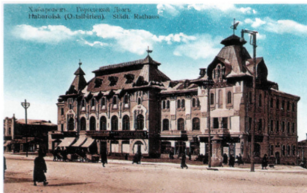
Фото 2. г. Хабаровск. Городской Дом по ул. М. Амурского №17, построенный по проекту П. В. Бартошевича и Б. А. Малиновского в 1909 г.

В связи с тем, что проект был разработан эскизно, то Дума поручила военному инженеру (архитектору) Б. А. Малиновскому доработать его. 26.11.1909 г. состоялось торжественное открытие Городского Дома 21 . В советское время в этом здании располагался Дворец пионеров.