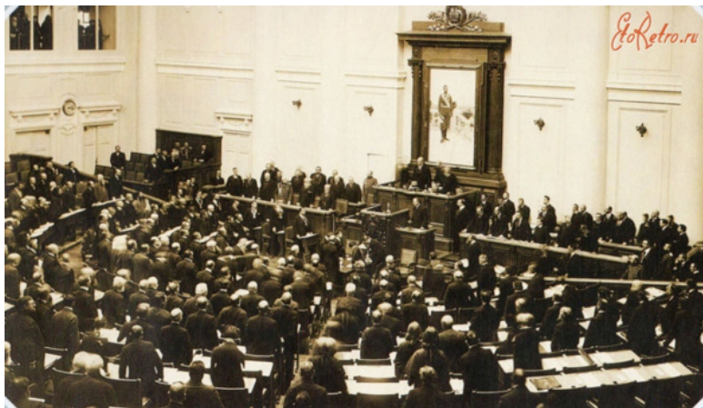
Фото 1. Заседание Государственной Думы

отправились в построенный когда-то Потёмкиным при Екатерине II Таврический дворец для деловых заседаний.