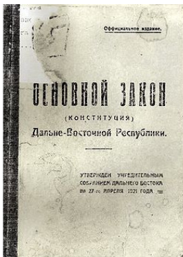
Фото 5. Обложка Конституции ДВР издания 1921 г.

В Народное Собрание второго созыва было избрано 124 депутата (из-за сложности обстановки и процедуры выборов на временно занятой интервентами и белогвардейцами территории Дальнего Востока не удалось избрать установленного (128) количества депутатов). Полных данных о результатах выборов в отдельных областях ДВР в материалах Центральной избирательной комиссии не сохранилось. В составе депутатов Народного Собрания ДВР второго созыва было 85 депутатов (около 68%) коммунистов и сочувствующих им, 18 (около 15%) эсеров, 3 (около 2%) меньшевика, 12 (около 10%) крестьян фракции меньшинства (кулаков), 1 (около 1%) демократ-максималист и 5 (около 4%) правых, т.е. преобладающее большинство (около 68%) в верховном государственном органе ДВР вновь получили представители