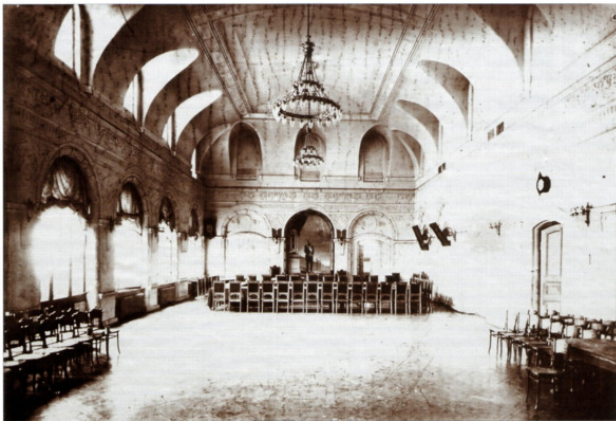
Фото 4. Зал заседания Хабаровской Городской Думы

Хабаровские историки, краеведы дают высокую оценку деятельности Хабаровской городской Думы этого периода, отмечая, что влияние Думы, занимавшей центральное положение в Дальневосточном крае, простиралось в некоторых акциях на весь край, имело отзвуки в Сибири, а через неё – в буржуазных кругах столицы 23 .