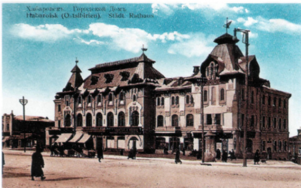
Фото 2. г. Хабаровск. Городской Дом по ул. М. Амурского №17, построенный по проекту П. В. Бартошевича и Б. А. Малиновского в 1909 г.

В связи с тем, что проект был разработан эскизно, то Дума поручила военному инженеру (архитектору) Б. А. Малиновскому доработать его. 26.11.1909 г. состоялось торжественное открытие Городского Дома 21 . В советское время в этом здании располагался Дворец пионеров.