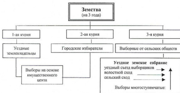
Схема 1. Структура и состав электората земского общественного управления

довавший на известную степень полномочий в управлении краем... Деятельность якутской Степной Думы закрепила определённые традиции якутского самоуправления. В частности, стремление найти компромиссные пути существования местной власти с центром» 14 .