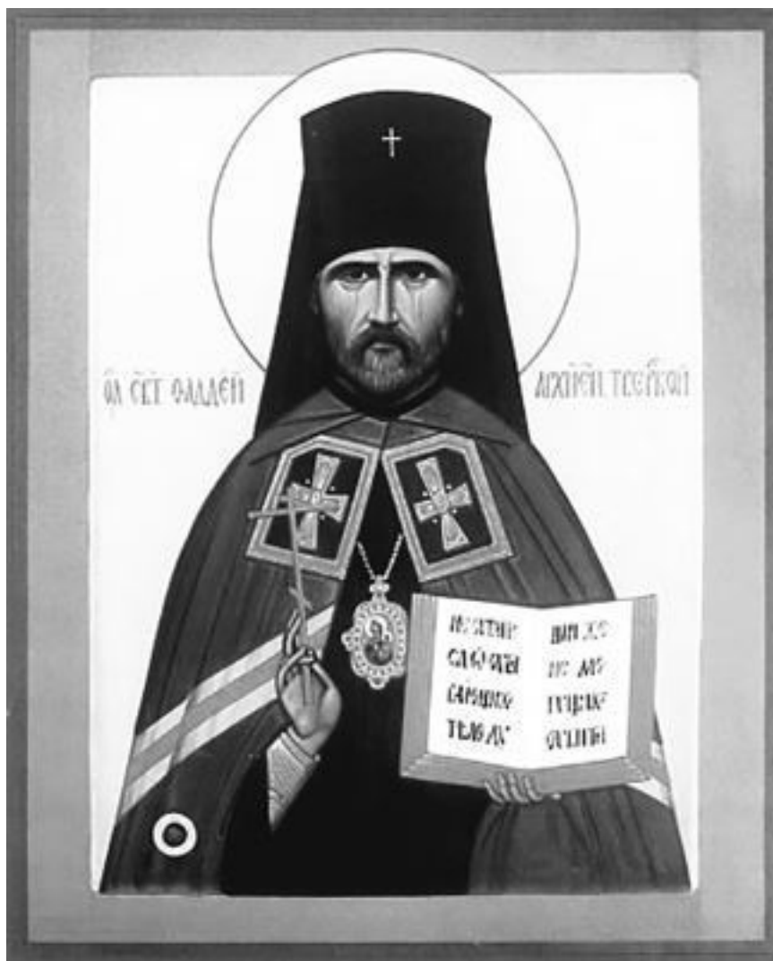
Священномученик Фаддей (Успенский И. В.). Икона