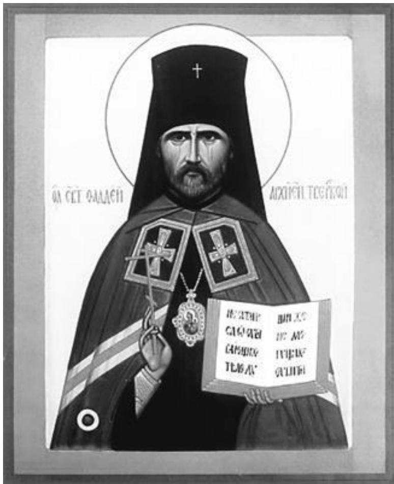
Священномученик Фаддей (Успенский И. В.). Икона