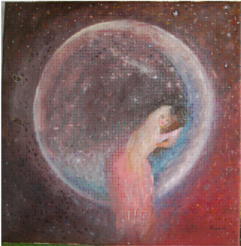
Картина «Летняя ночь» – автор Людмила Коура (КоМи-ла).