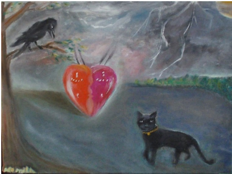
Картина «Чёрный Кот» – автор Людмила Кочура (КоМи-ла)