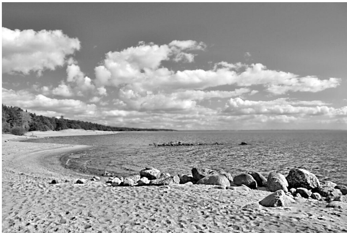
Иллюстрация 1. Южный берег Финского залива.

Грядущий июльский день обещал быть жарким. На небе не было ни облачка, по всему горизонту, от края до края. Звёзды перед рассветом стали бледнее и постепенно угасали. Солнце своими первыми лучами, словно длинными тонкими руками, нежно, будто боясь нарушить хрупкую утреннюю тишину, слегка тронуло спокойную гладь Финского залива, его песчаные берега, местами поросшие камышом, погладило макушки деревьев.