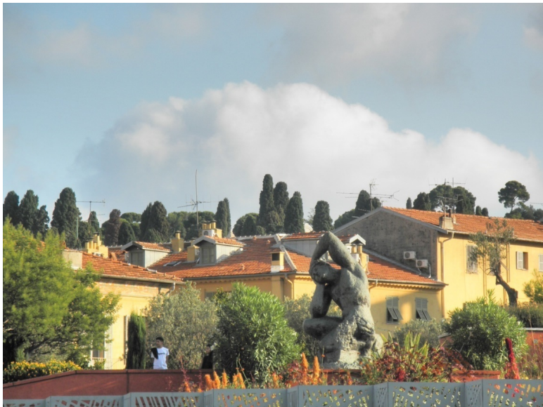
Скульптура в саду библиотеки и вид на старый квартал.