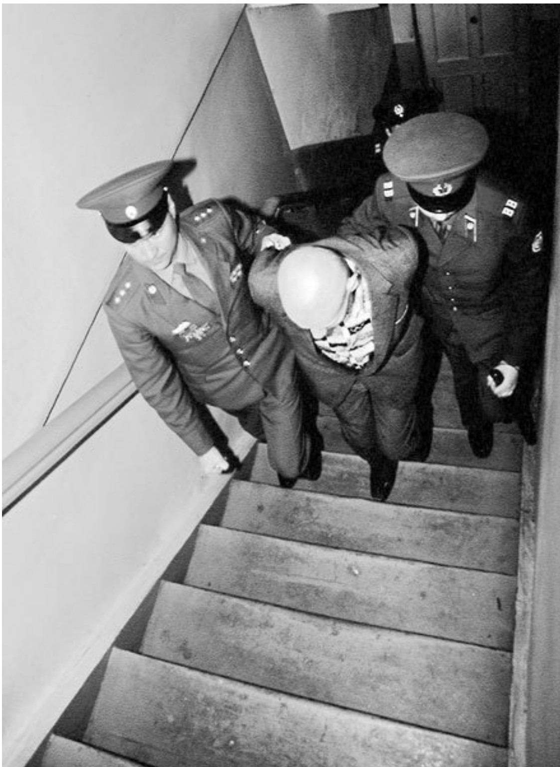
Чикатило в заключении. 1992 год. На суде он демонстрировал явные признаки психоза, регулярно раздевался и обнажал половые органы, пел и отказывался отвечать на вопросы.