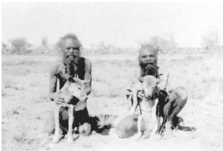
Два аборигена с динго, 1957