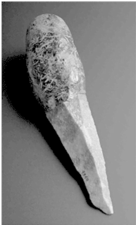
Австралийский нож для обрезания, 1850–1920

Во-вторых, до европейцев австралийцы нередко контак-