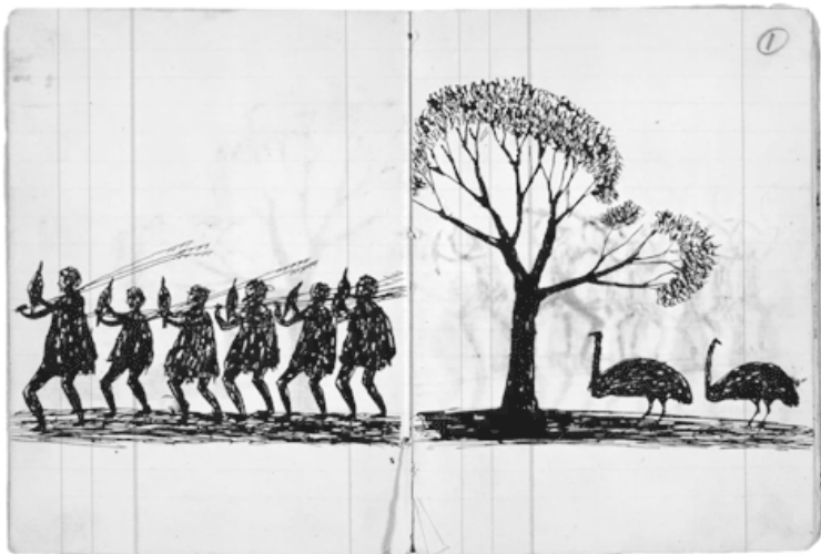
Охотники и эму, 1875. Рисунок Томми Макрея, одного из самых известных художников-австралийцев XIX века

То же касается и растений: по-видимому, на континенте в момент появления человека росли дождевые леса, сохранившиеся еще со времен, когда Австралия была частью Гондваны. Как ни сложно сейчас в это поверить, все здесь было покрыто растительностью 12 . Но в наши дни дождевые леса составляют пару процентов от территории континента, сохранившись только на восточном побережье, а центральную