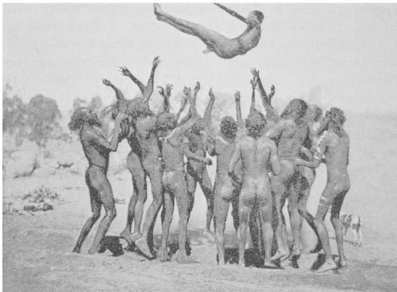
Один из обрядов аранда, 1904