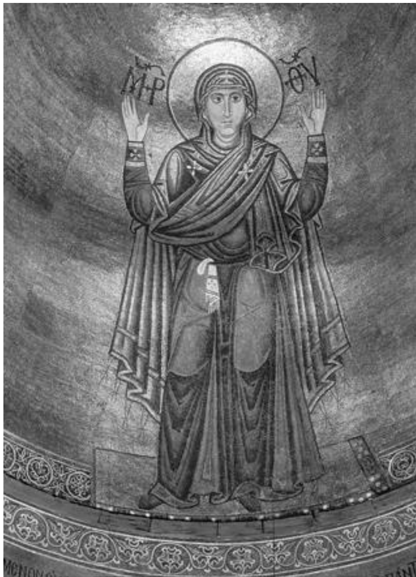
Богоматерь Оранта (Нерушимая Стена). Мозаика в алтаре Софийского собора в Киеве, XI век

Мозаики в соборах были для верующих книгой, по которой они изучали жизнь святых и основные притчи христианского вероучения. Это была целая система наглядного провозглашения идеи, своего рода «Евангелие для неграмотных».